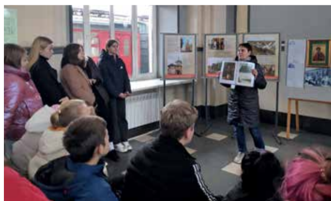
Экскурсия на железнодорожном вокзале станции Бологое-Московское