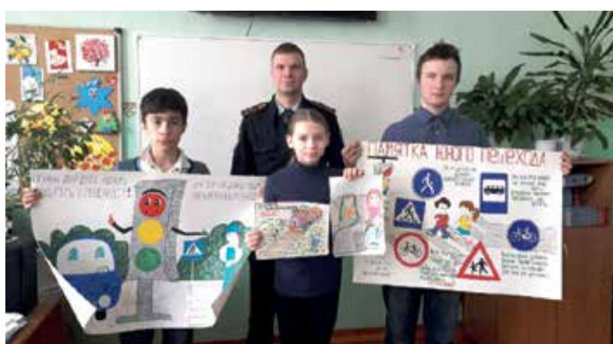
Конкурс детских рисунков «Сохрани свою жизнь». Архангельский ЛО МВД России на транспорте