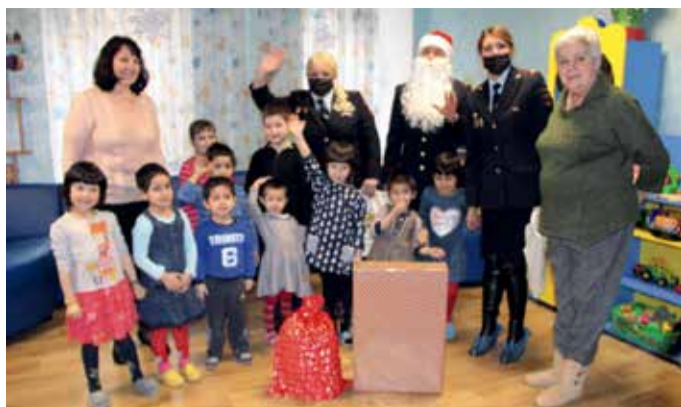
Визит в социальный приют для детей «Транзит»