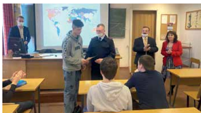
Визит сотрудников СПб-Финляндского ЛО МВД России на транспорте в Санкт-Петербургский технический колледж

Общественный совет при УТ МВД России по СЗФО зарекомендовал себя, как объективный институт гражданского общества, решения и деятельность которого носят не формальный характер, что значительно повышает авторитетность заявлений Общественного совета среди населения.