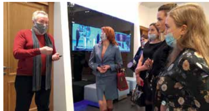
Семинар в информационном агентстве Северо-Запад-ТАСС