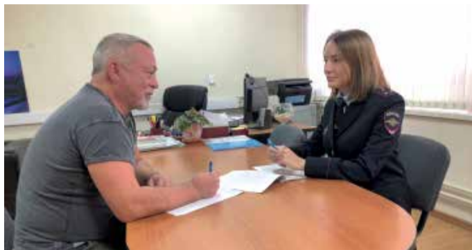
Работа в аттестационной комиссии