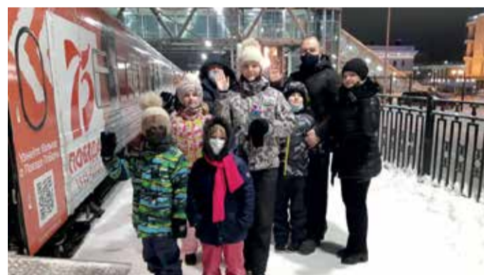
Поезд Победы в Петрозаводске