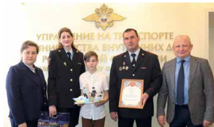
Акция «Полицейский Дядя Степа»