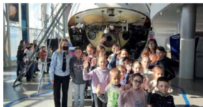
Акция «Знакомство с подводным миром» г. Калининград