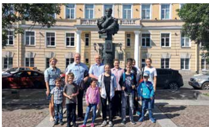
Экскурсия в ПГУПС императора Александра I