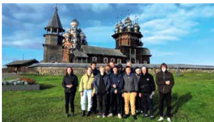
Экологическая программа в музее-заповеднике «Кижі»