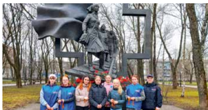
Акция «Георгиевская ленточка» Вологодского ЛО России на транспорте