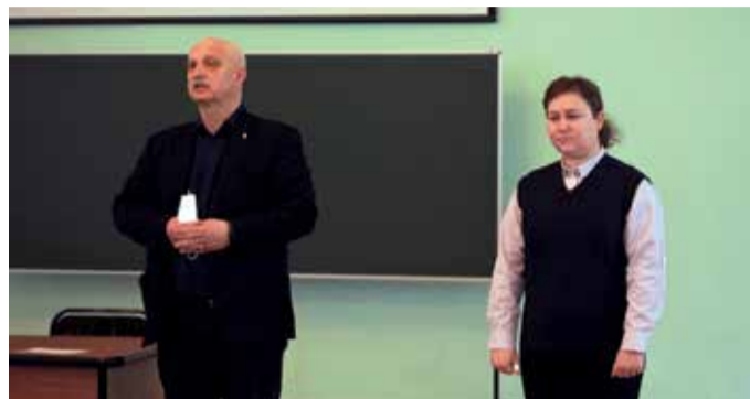
Кураторский час с транспортной полицией