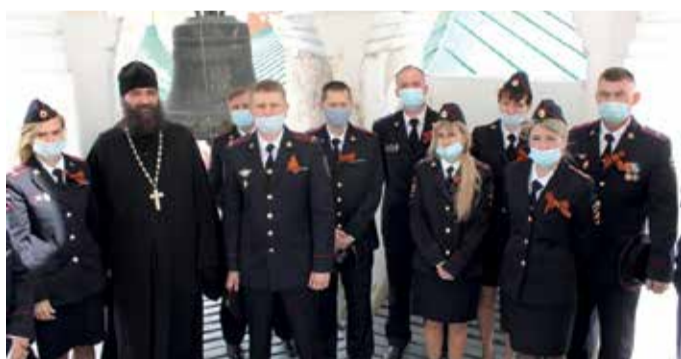
Визит сотрудников Северного ЛО МВД России на транспорте в гарнизонный Храм Архангела Михаила г. Ярославля