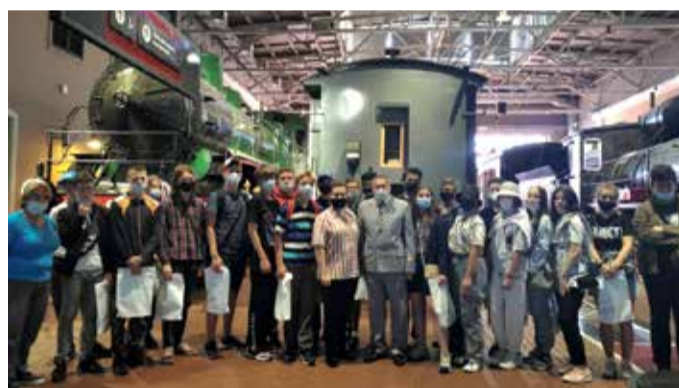
Экскурсия в Музей железных дорог России