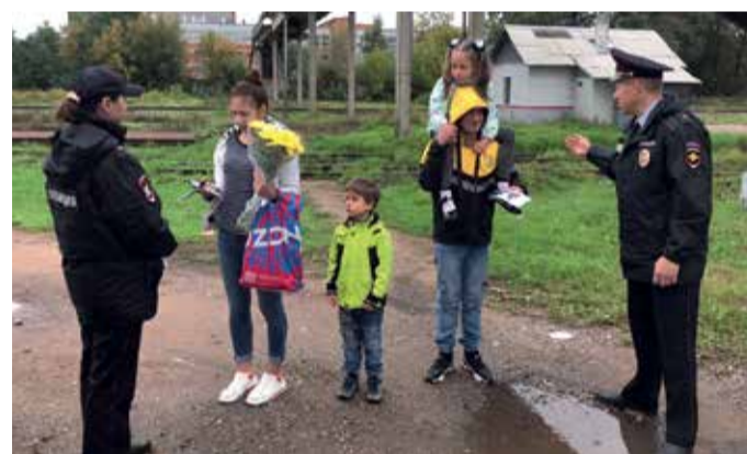
Акция «Безопасный путь» Псковского ЛО МВД России на транспорте