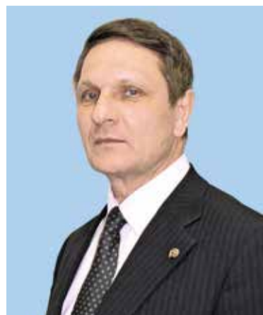
КОТЕНКО Геннадий Емельянович, генерал-лейтенант в отставке, начальник отдела безопасности и правоохранительной деятельности Департамента оборонной промышленности и военно-технического сотрудничества Постоянного комитета Союзного государства