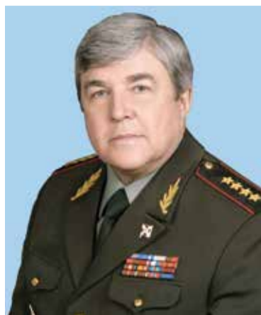
РОГОЖКИН Николай Евгеньевич, генерал армии, Главкомандующий внутренними войсками МВД России (2004—2014). Полномочный представитель Президента Российской Федерации в Сибирском федеральном округе (2014—2016)