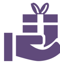
Возможность сделать подарок