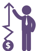
Возможность заработать больше