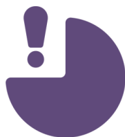
Возможность НЕ дать скидку