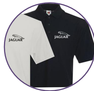
Вышивка на одежде