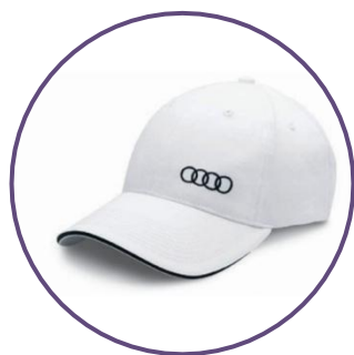
Вышивка на бейсболках

(продажа высокомаржинальных товаров – одно из лучших решений)