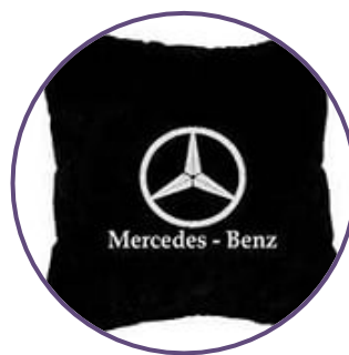
Вышивка на подушках