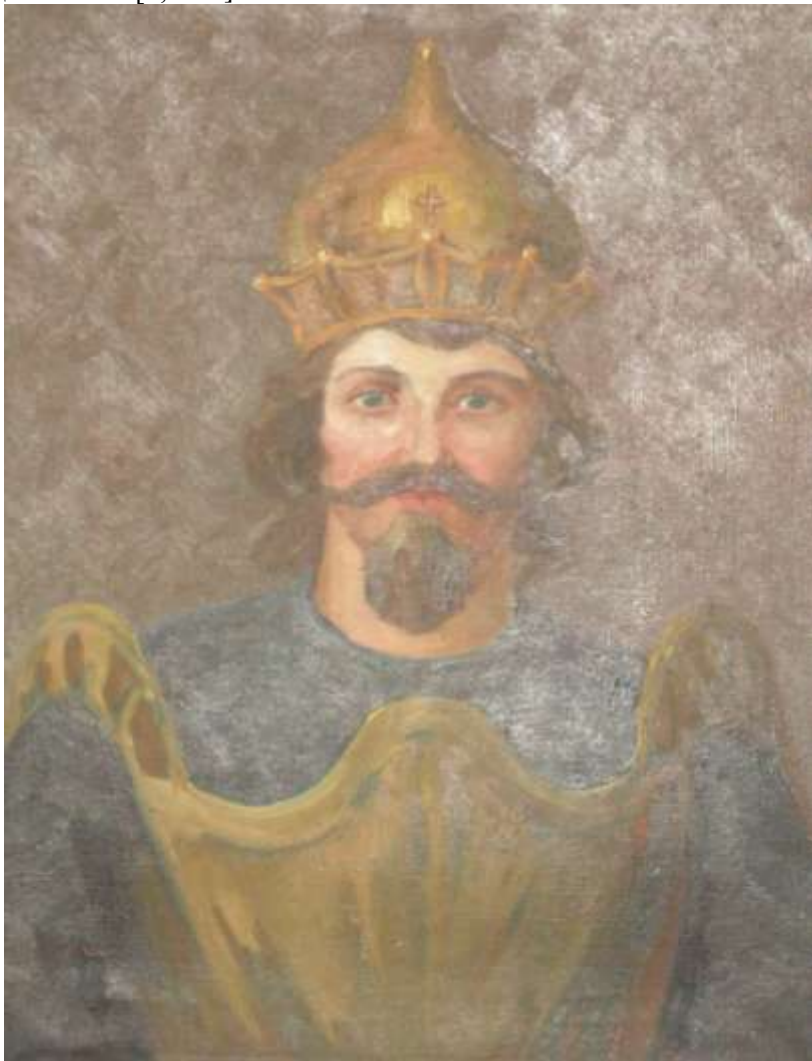
7. Князь Володимир Галицький( 1141-1153рр).

Князь Володимир Володарович Галицький був справжнім надхненником своєї справи. Незалежність для Галичини і перетворення останньої в могутню центрально-європейську державу було справою усього його життя. За для цього він не гребував нічим, ні військовими кампаніями ні тонкощами дипломатії [9, с.90].