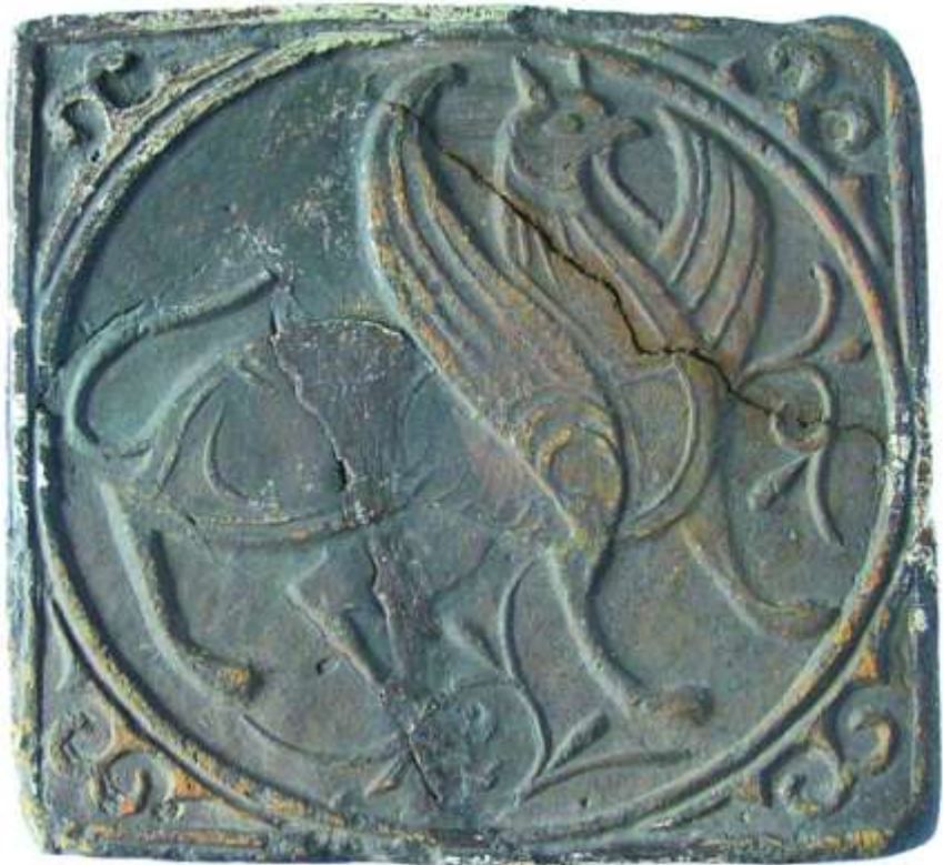
9.Плитка XII століття з Галича

1153-1187 роках, вся подальша історична доля якої, після його смерті у 1187 році, потребує подальшого дослідження [6, с.71-87].