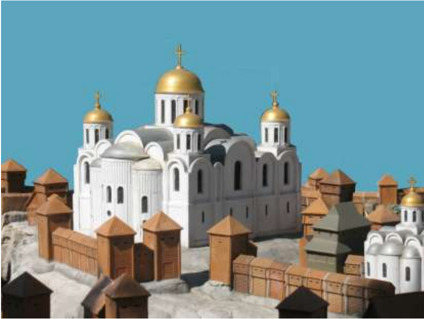
5. Галицький Успенський кафедральний собор XII століття побудований князем Ярославом Галицьким.

Санкт-петербургські дослідники І. Фроянов та А. Дворніченко вважають, що внаслідок швидкого внутрішнього розвитку і не втручання сусідів у внутрішні справи Галичини, галицька громада зуміла перетворити свою Галицьку державу у квітучу, добреулаштовану економічно і політично європейську країну. Галичина, була настільки могутня, що тепер уже галицька військова допомога йшла то Києву, то Візантії то Угорщині. І хоча на самому початку галичани були незадоволені політикою князя Ярослава, однак останньому внаслідок гнучких економічних та законодавчих реформ, які в основному базуються на центрально-європейському економічному та цивільному праві, йому вдалося не тільки заспокоїти міську та сільську, як торгово-економічну так і сільськогосподарську знать, але й на чолі боярства об'єднати все галицьке суспільство єдиною державницькою ідеєю. Щоб продовжувати свої реформи князь Ярослава Галицький спочатку зміцнив військову організацію, на чолі якої стояли випробувані і досвідчені в боях бояри,