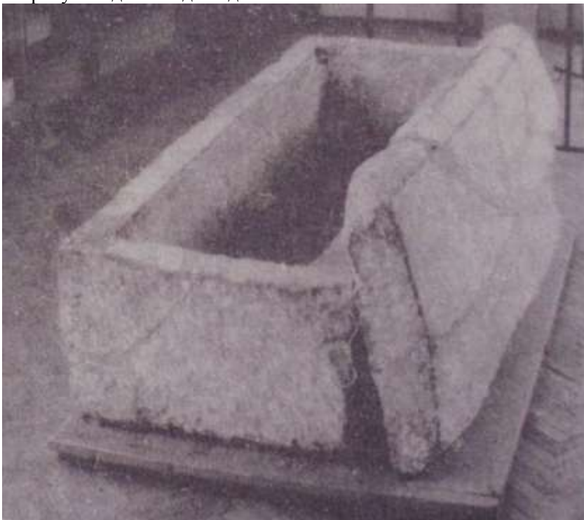
8.Саркофаг князя Ярослава Галицького. Івано-Франківський краєзнавчий музей.

Галицькому, що означає уже новий період галицької історії, який потребує подальшо дослідження.