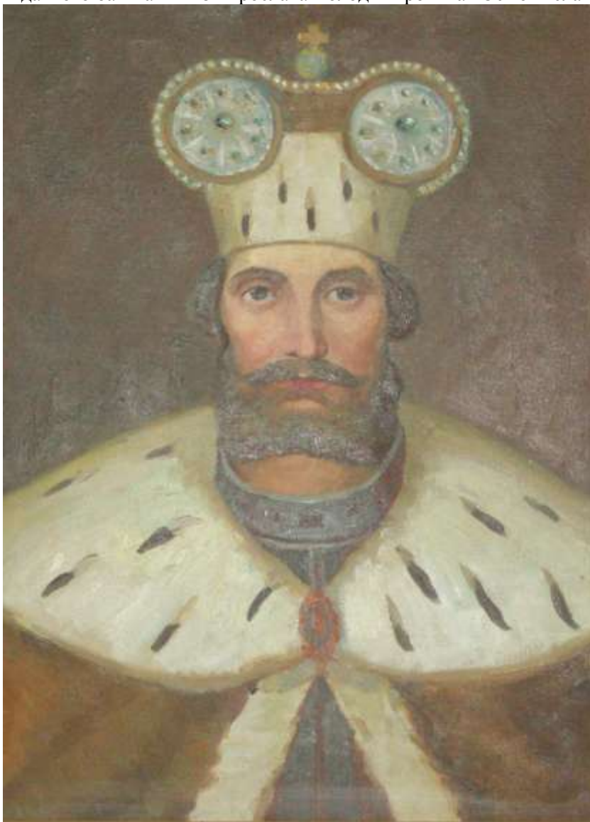
7.Князь Ярослав галицький (1153-1178рр.)

міцності Галицької держави і бажав продовжувати політичну, економічну та культурно-християнську діяльність свого видатного батька - князя Ярослава Володимировича “Осмомисла”.