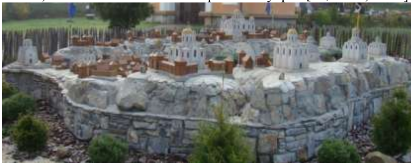
6.Галич епохи князя Ярослава Галицького (1153-1187рр.)

Про діяльність князя Ярослава Галицького розповідає і візантійський літописець Микита Хоніат в контексті взаємовідносин візантійського імператора Андроніка Комнина і князя Ярослава Галицького: «Він був прийнятий правителем Галичини немов рідним братом, пробув у нього досить довго і до того прив'язав його до себе, що разом з ним полював і засідав у дімі і жив в одному з ним палаці і разом обідав. Коли ж Андронік у 1183 році став імператором, він побудував розкішні палати, де були розписані сюжети його полювання в Галичині на турів-зубрів. Живопис уявляв собою кінну їзду Ярослава Осмомисла і Андроніка з собаками, крик птахів, гавкання собак, полювання на оленів, забитого списом кабана і ранення зубра» [29, с.167, с.420].