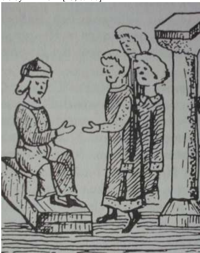
1. Князь Ярослав Галицький сидячи на престолі радиться з галицькими боярами.

Ярослав Галицький признає васалітет щодо князя Із'яслава Київського ми не знаходимо свідчень, що князь Ярослав Галицький згоджувався негайно віддати Бужську землю і Погоринські міста. В цьому ми бачимо розумну дипломатію молодого князя Ярослава. За таких обставин, можна наголосити, що посол, який приїхав від київського князя, боярин Петро Бориславович поїхав до Києва з рішенням князя Ярослава досить компромісним: з васалітетом, але без Бужська і Погоринських міст, що фактично зводило до нуля сам васалітет, а отже про віддання київському князю Із'яславу Бужкої землі й Погоринських міст не могло бути і мови [23, с.470].