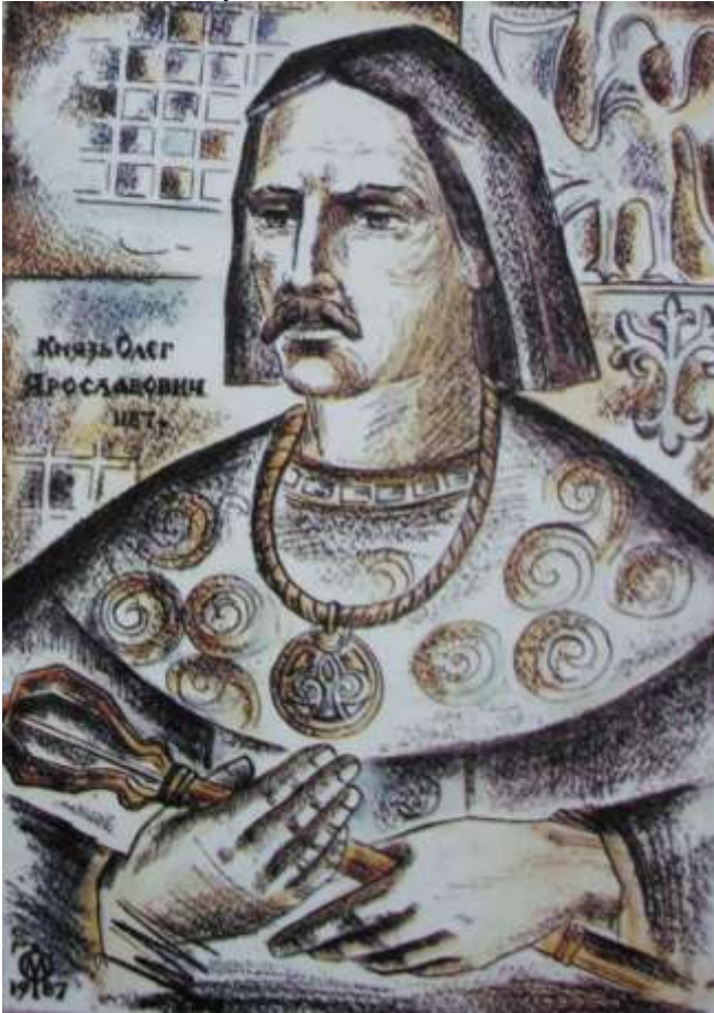
1. Князь Олег Ярославович галицький (1187р.)

Згідно свідчень “Повісті минулих літ” та інших середньовічних джерел, привертає увагу особа галицького князя Олега Ярославовича. Який хоча і був молодшим сином князя Ярослава галицького, однак, по заповіту могутнього батька, успадкував галицький трон.