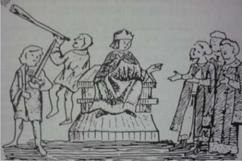
2. Молодий князь Ярослав Галицький на троні. Мініатюра з Радзивилівського літопису XV століття.

Давньогалицьке джерело «Слово о полку Ігоревім» теж наголошує, що князь Ярослав сидить на золотокованому престолі. На мініатюрі Радзивилівського літопису герольд-мечник стоїть тримаючи заголеного меча, така традиція була в Угорщині. Біля нього, як наголошують угорські джерела, «його руські принци, барони, рицарі закуті в лати-броні та угорські шоломи». Таким побачив київський посол оточення князя Ярослава Галицького в час смерті його батька князя Володимира Володаровича Галицького.