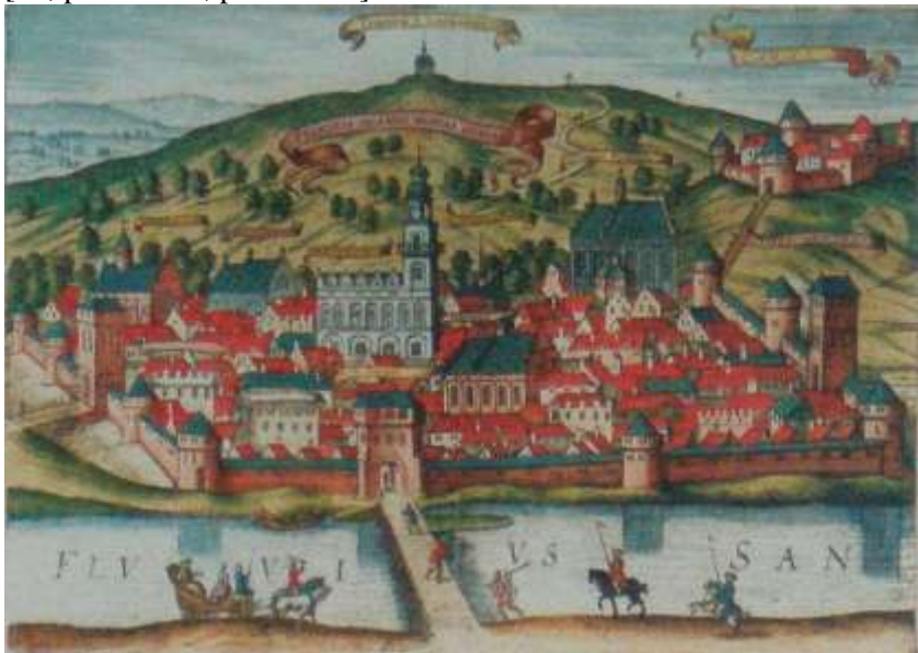
2. Вид Перемишля. Картина. Художник Jerzy Braun 1617 г.

Польський літописець Ян Длугош зауважував, що Перемишль у IX-XI століттях був дуже добре укріпленим містом, у ньому перебував сильний руський гарнізон і княжа дружина [49, р. 407-408; р. 533-534].