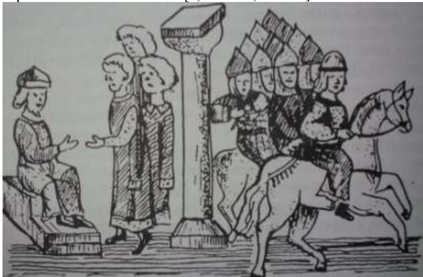
4. Князь Ярослав Галицький під час правління та на чолі галицького війська.

час Теробовлянської битви: «Ти у нас князь один, що ми без тебе, як вівці без пастиря». Дослідник М. Дашкевич вважав, що така форма правління в Галичині у вигляді одного князя і багаточисельного боярства розвинулася внаслідок впливу політичної інфраструктури Угорської держави, де був один король та безчисельна знать [2, с.19-21; с.24-33].