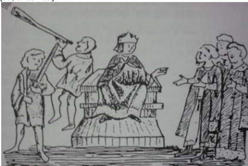
6. Радзівілівський літопис XV століття. Молодий князь Ярослав Галицький на троні.

В Радзивілівському літописі, цій зустрічі присвячена мініатюра, на якій зображений Ярослав Осмомисл на троні в короні, поряд стоїть герольд, мечник з заголеним мечем. Ту же є свідчення про гордих галицьких бояр та грізних галицьких рицарів. Все це в сукупності малює, наголошував дослідник Б.О. Рибаків, недостатньо вивчену галицьку державну організацію [35, с.163-165].