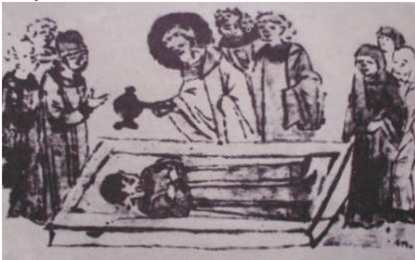
5. Руський літопис. Похорон князя Володимира Галицького.

додержати і з нами обома бути, то поверни мої городи». - І сказав Володимир Перту Бориславичу - ти скажи: «ти брате вибрав еси час проти на мене і короля на мене привів еси. Але якщо буду я жив, то або голову зложу, або за себе одомщу. І як тільки Петро з'їхав з княжого двору, то Володимир пішов до божниці до святого Спаса, на вечірню, тобто пішов галереєю, яка з'єднувала другий поверх князівського палацу з хорами церкви до божниці і тут побачив Петра, який поїхав, то поглузував над ним і сказав: «Поїхав муж руський схопивши всі волості», і це сказавши пішов він на хори. Одспівавши вечірню, Володимир таки пішов із божниці і коли був він на тім місці на сходах де ото поглузував над Петром він сказав: «ой се хтось мене вдарив в плече». Але тут його підхопили під руки і однесли його в горницю і поклали в окуп... І настав вечір і став Володимир знемагати вельми, а коли була пора спати, тоді Володимир Галицький представився» [36, с.257].