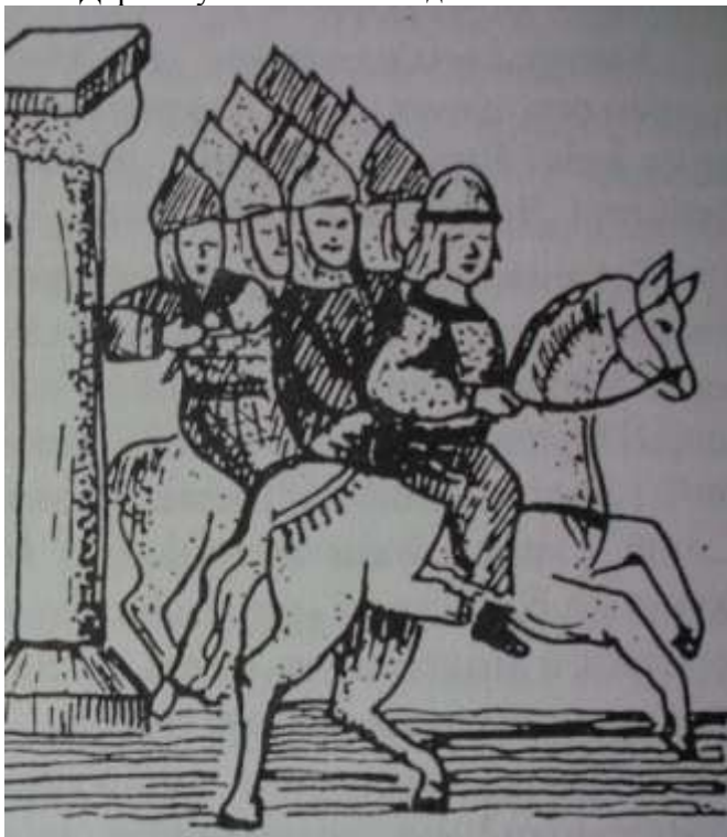
3. Князь Ярослав Галицький на чолі галицьких військ виступає на Київ.

В цей же час князь Ярослав Володимирович Галицький уклавши договори з володимирським князем Мстиславом Із'яславовичем і князем Володимиром Андрієвичем Дорогобужським, здійснював усі приготування до відбиття нападу. Великий князь Із'яслав Давидович знаючи настрої галицьких міщан вирішив використати слушний момент і тому впершу чергу він виступив на Галич. Під Мукоревим, коли чекав він підмоги, дружину свого племінника, довідався, що князь Ярослав Галицький з усіма своїми полками виступив на Київ, а князь Мстислав Із'яславович Володимирський і Володимир Андрійович Дорогобужський теж з'єднали з ним свої полки.