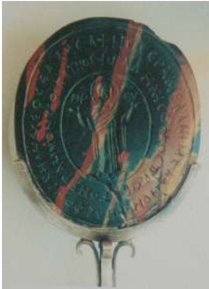
1. Печатка Перемишльських єпископів IX-X століть.

Наявність могутніх державних утворень, торгово-економічних організацій на території Прикарпаття та Подністров'я, зокрема Перемишльського, Звенигородського, Терехівського, Галицького та Берладського князівств, які політично та економічно в першій чверті XII століття об'єднала династія князя Ростислава Володимировича, який отримав у спадкове володіння ці князівства від свого діда, великого київського князя Ярослава Мудрого, дало підстави розглянути розвиток цієї Прикарпатської держави, Великої чи Білої Хорватії, яка сконцентрувалась навколо міста Перемишля, який у IX-XI століттях був політичним, торгово-економічним та культурно-релігійним, єпископським центром усіх цих великих одноетнічних територій від Сяну до Дністра[1, с. 2-10; 10, с. 199-201].