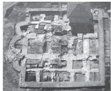
УСПЕНСЬКИЙ СОБОР У ГАЛИЧІ, В ЯКОМУ 7 СІЧНЯ 1215 РОКУ БУЛО КОРОНОВАНО КНЯЗЯ КОЛОМАНА НА КОРОЛЯ ГАЛИЧИНИ

Як висловився визнаний дослідник, доктор історичних наук, академік В. Грабовецький, «галицькі бояри — це багаточисленні стародавні князьки, що володіли слов'янськими округами Карпато-Дністровської цивілізації до злучення в єдине в VI-X ст. Хорватське