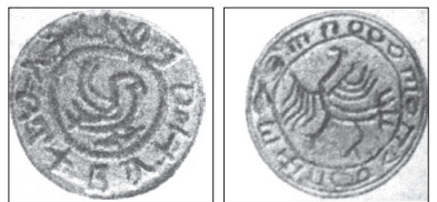
ПЕЧАТКИ БОЯР ГАЛИЦЬКОГО КНЯЗІВСТВА З ГЕРБОМ — ГАЛКОЮ

У цей час на галицьких землях, як зазначено в Галицько-Волинському літописі, «були беззаконня і галицькі повстання». Джерела з Секретного Ватиканського архіву засвідчують, що Папа Іннокентій III знав про стан політичних справ у Галичині все, тому посольство кардинала Григорія, яке виїхало з Риму в жовтні 1207 року і прибуло в Угорщину на початку 1208 року,