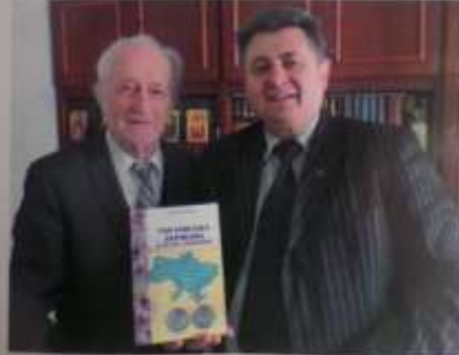
Львів, «Видавництво Інституту Східної Європи», 2020

Співпраця Інституту Східної Європи з Перемишльським Відділом Українського Історичного Товариства в Польщі. Історико-фотографічне дослідження