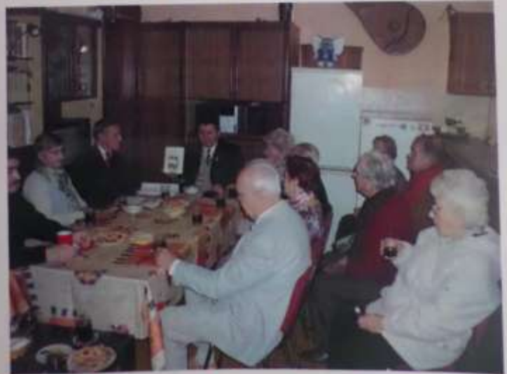
Львів, «Видавництво Інституту Східної Європи», 2020

Співпраця Інституту Східної Європи з українською громадою Тшеб'ятова Об'єднання українців в Польщі. Історико-фотографічне дослідження.