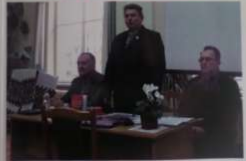
Львів, «Видавництво Інституту Східної Європи», 2020

Інститут Східної Європи у співпраці з українською греко-католицькою громадою міста Любачева що у Польщі. Історико-фотографічне дослідження