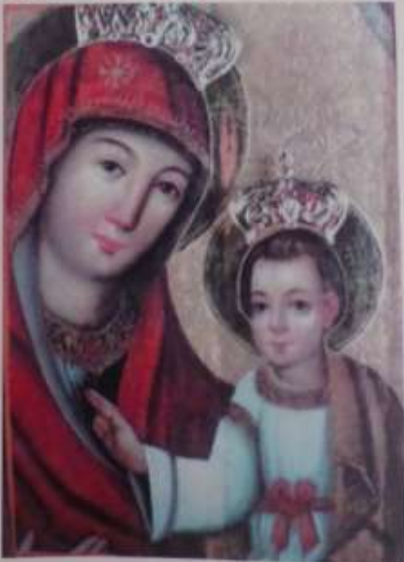
Львів, «Видавництво Інституту Східної Європи», 2020

Інститут Східної Європи у співпраці з українською греко-католицькою громадою міста Ярослава що у Польщі. Історико-фотографічне дослідження