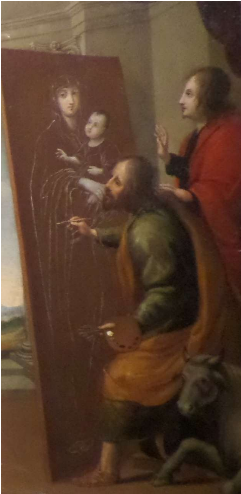
Св.15. Картина 3. Євангелист Лука малює Богоматір. Музей базиліки «Санта Марія Маджоре».