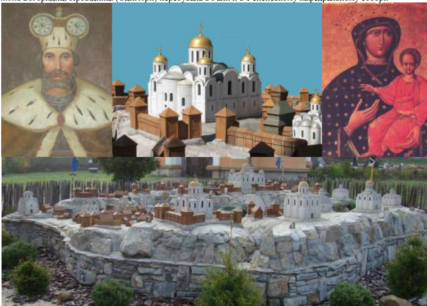
Св.2. Портрет князя Ярослава Галицького. Св.3. Успенський собор у Галичі.

По всій вірогідності ікона Богородиці Провідниці (Одигітрії) знаходилася з X до XII століття у Десятинній церкві. Відомо лише, що великі київські князі у X-XII століттях брали її у воєнні походи, коли захищали Русь-Україну від чисельних ворогів. 22 грудня 1158 року князь Ярослав Володимирович Галицький на чолі своїх могутніх галицьких полків, урочисто вступає в столицю Русі-України, місто Київ. Захопивши Київ він переніс ікону з Києва і поставив її у кафедральному Успенському соборі у місті Галичі. Отже з 1159 року по 1241 рік ікона Богородиці Провідниці (Одигітрії) перебувала в Галичі в Успенському кафедральному соборі.