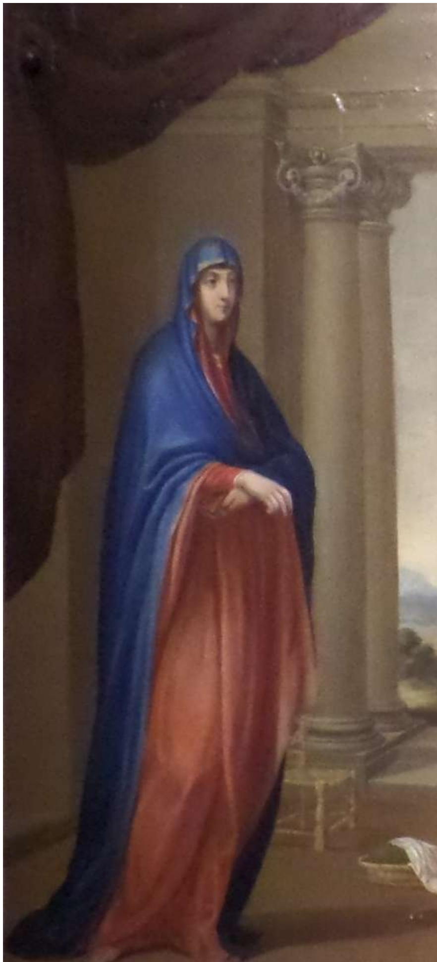
Св.14. Картина 2. Богоматір з Музею базилики «Санта Марія Маджоре» написана євангелистом Лукою.