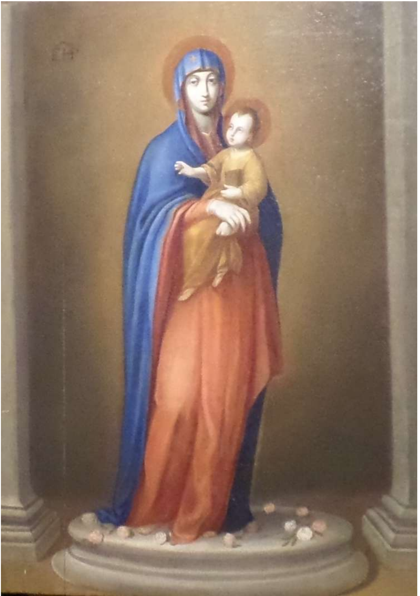
Св.13. Картина 1. Богоматір з Музею базиліки «Санта Марія Маджоре» написана євангелистом Лукою.