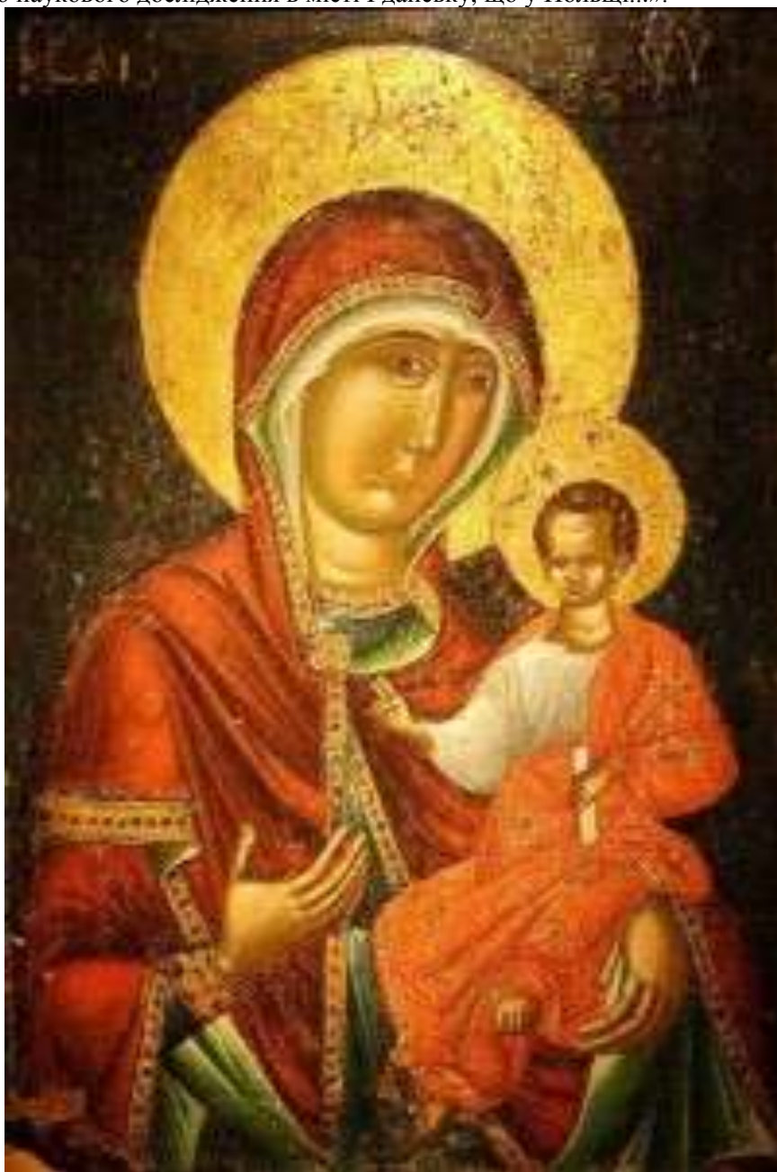
Св.12. Копія ікони Богородиці Провідниці (Одигітрії). Львівський Музеї історії релігії.