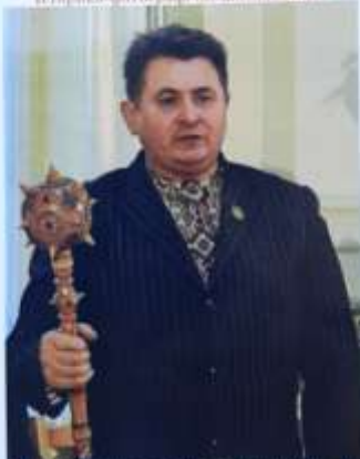
Київ, «Надземці» Інституту Східної Європи, 2020