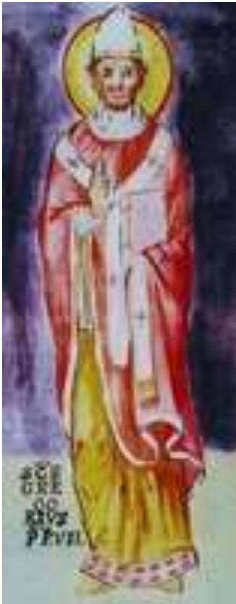
Святий Папа Римський Григорій VII. Мініатюра із «Кодексу Барберіні». (Vat. Barb. Lat. 4423).