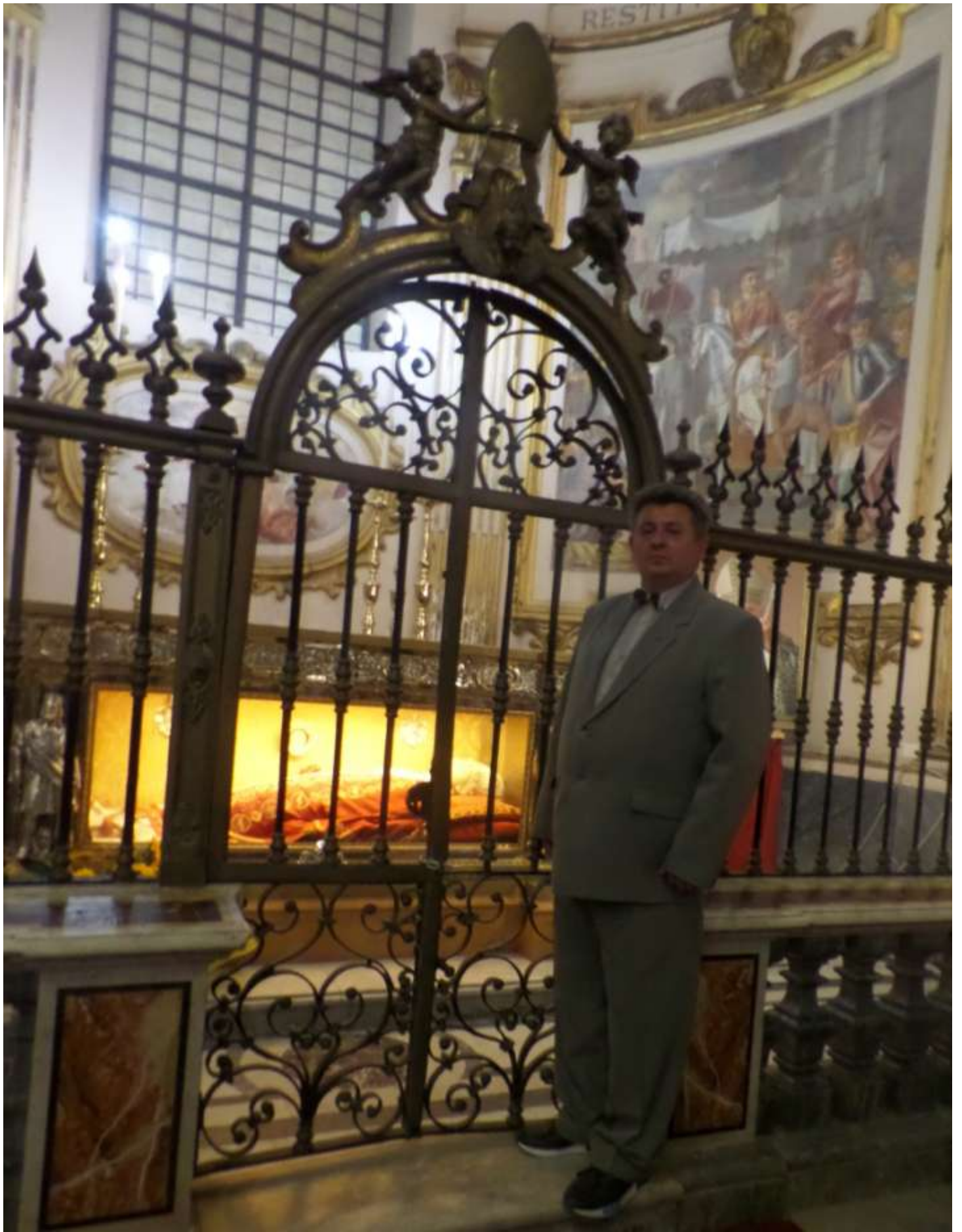
Гробниця Святого Папи Римського Григорія VII в кафедральному соборі святого Матвія в італійському місті Салерно.