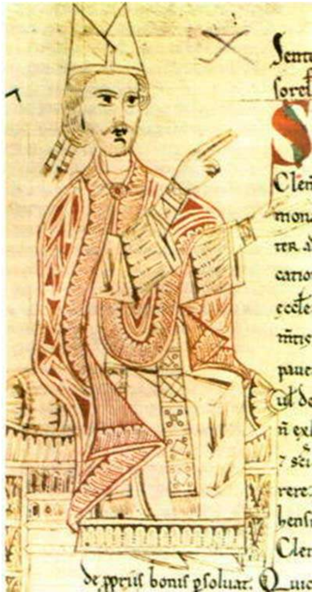
Папа Римський Григорій VII. Малюнок із рукопису XI століття.