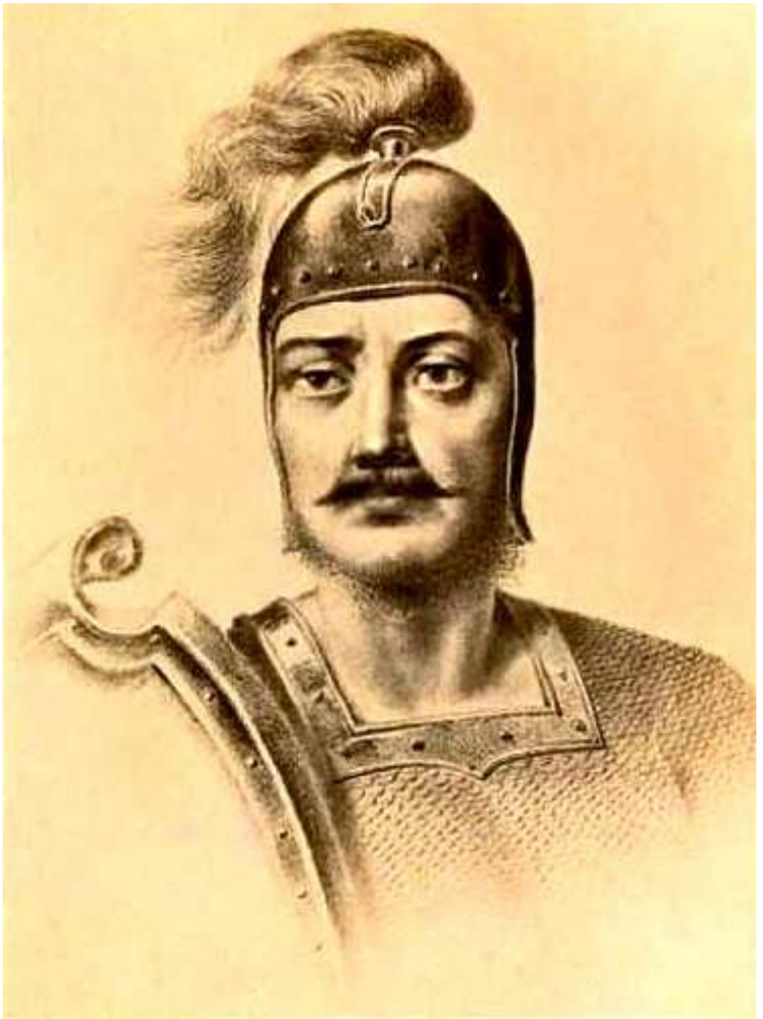
Великий київський князь та всієї Русі-України Із'яслав (Дмитро) Ярославович.