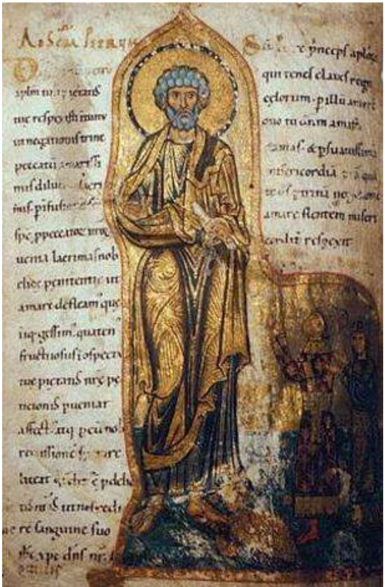
Сторінка з «Кодексу Гертруди». Князь Ярополк-Петро Із'яславович його дружина польська принцеса Ірина прохають допомоги в намісника святого Петра, Папи Римського Григорія VII.