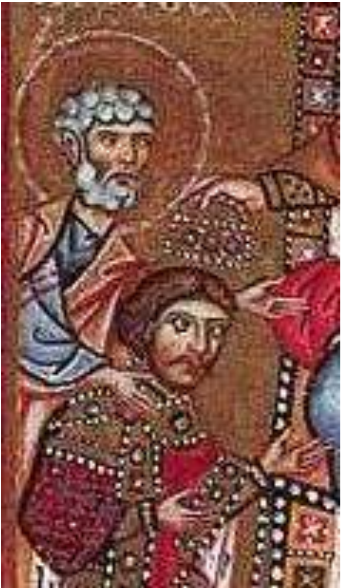
Сторінка з «Кодексу Гертруди». Коронація Ярополка-Петра Із'яславовича на короля Руси-України.