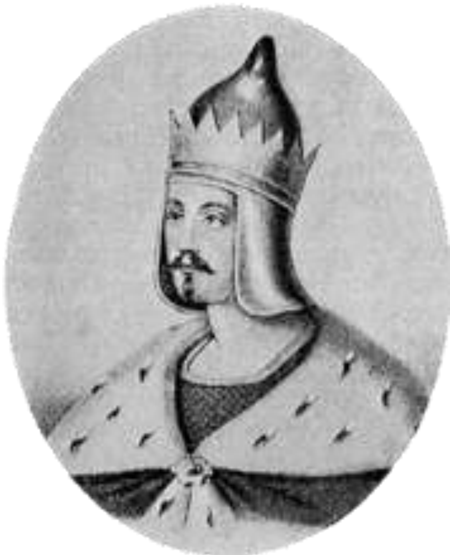
Коронований Папою Римським Григорієм VII король Руси-України Із'яслав I Великий.