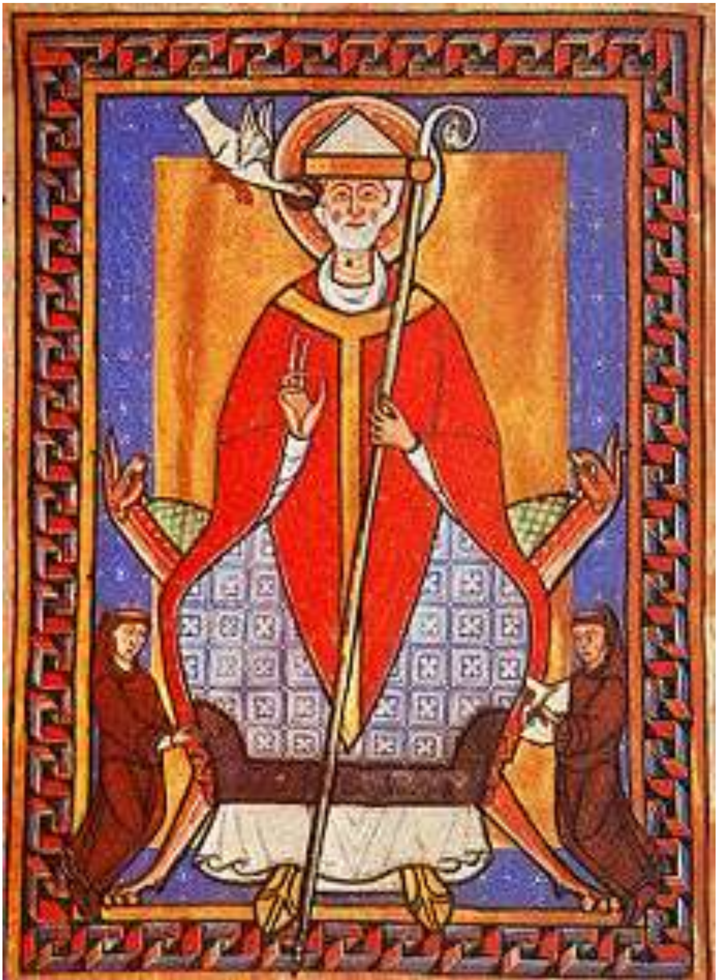
Святий Папа Римський Григорій VII. (Gregory VII. Illustration).