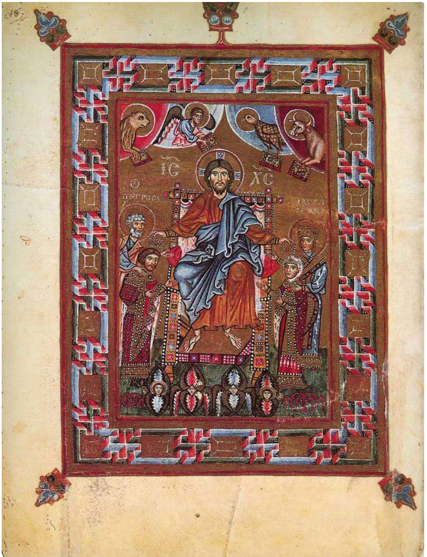
Титульна сторінка «Кодексу Гертруди» XI століття.