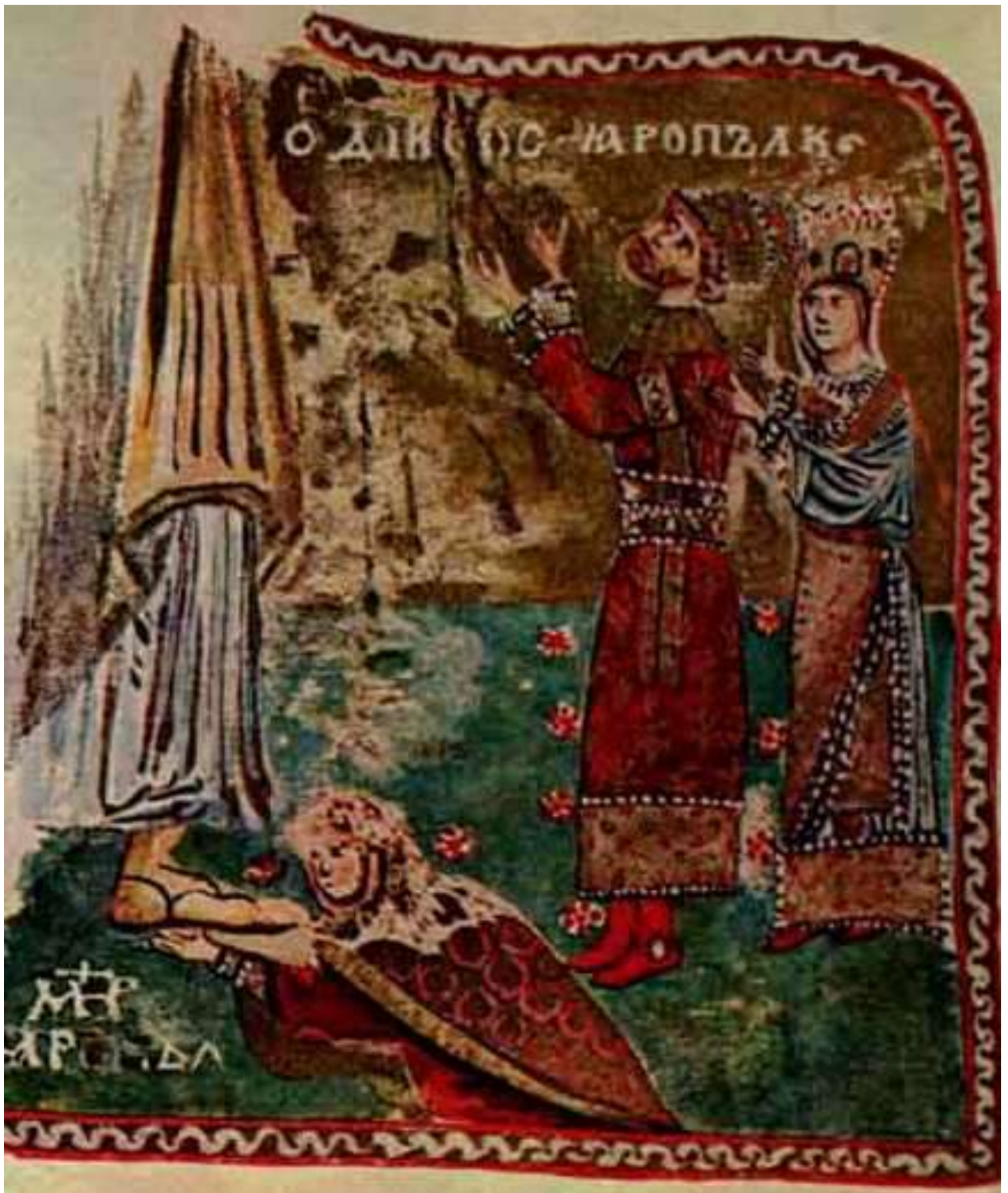
Сторінка з «Кодексу Гертруди». Король Руси-України Ярополк-Петро Із'яславович, королева Ірина дають обіцянку що утвердять римську християнську віру в усьому Королівстві Руси-України.