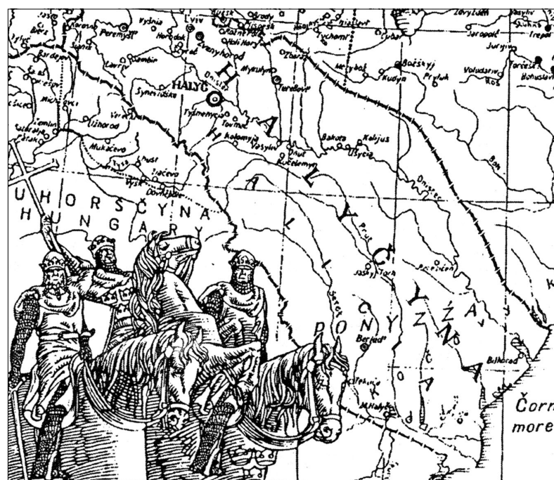
МАПА ГАЛИЦЬКОГО КОРОЛІВСТВА

Тодішній галицький князь Мстислав, перебуваючи на з'їзді князів у Києві, відрядив для захисту Галича своїх найдосвідченіших воявод з передовими полками, щоб перешкодити просуванню ворожих військ углуб руських земель.