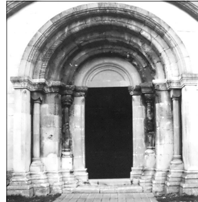
РОМАНСЬКИЙ СОБОР ПАНТЕЛЕЙМОНА, ЗБУДОВАНИЙ УГОРСЬКИМИ МАЙСТРАМИ

Папою IV Латеранському соборі). Угорський король разом із папським послом назад до Риму відправив і двох своїх послів з листом до Папи Іннокентія III. У цьому документі, який не має дати і, очевидно, був написаний влітку 1215 року, бо згадує про IV Латеранський собор як про недалекий, зазначалося: «Останнім часом народ Галичини, зломивши прися-