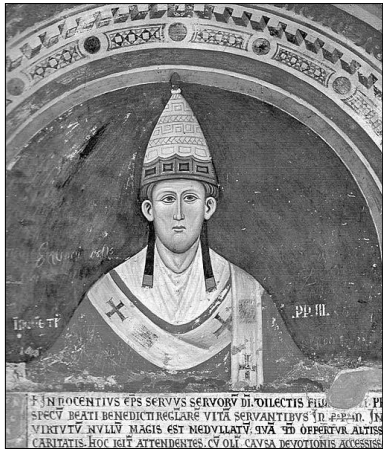
ПАПА РИМСЬКИЙ ІННОКЕНТІЙ III — ЗАСНОВНИК ГАЛИЦЬКОГО КОРОЛІВСТВА В 1215 РОЦІ

Наприкінці грудня 1214 року Папа Іннокентій III вислав до Галича всі королівські регалії: корону, скипетр і кулю, а також штандарт Галицького королівства, який складався з червоного полотнища з чорною галкою в золотій короні.