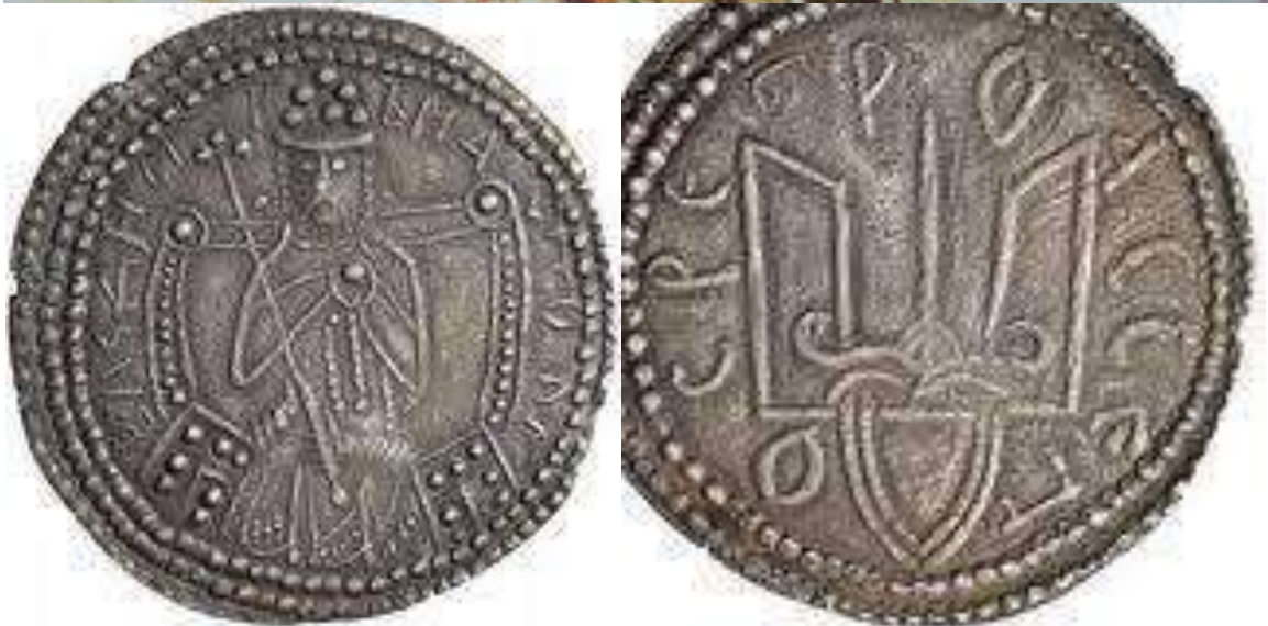
Великий князь Руси-України Володимир Мономах та гривня його часу.