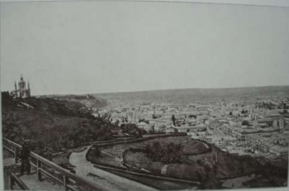
Die Unterstadt von Kyjiw.