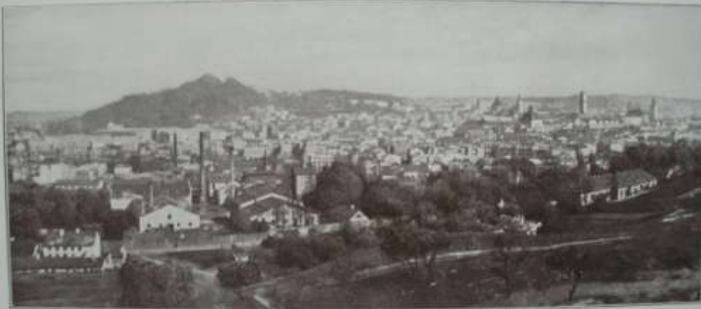
Lemberg. Die westlichsten Ausläufer der podolischen Platte.