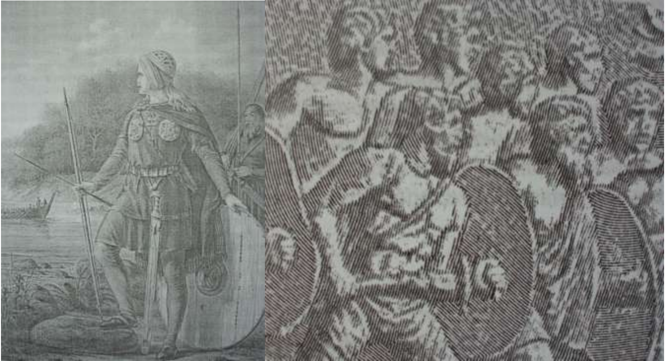
Мал. 1. Готський король Остгота в час приходу в III ст. н. е. у Прикарпаття і Подністров'я.

Важливою проблемою є вивчення присутності германських народів - готів та гепідів на території Галичини (Прикарпаття і Подністров'я) в пізньо-римський час у III-IV століттях н. е.