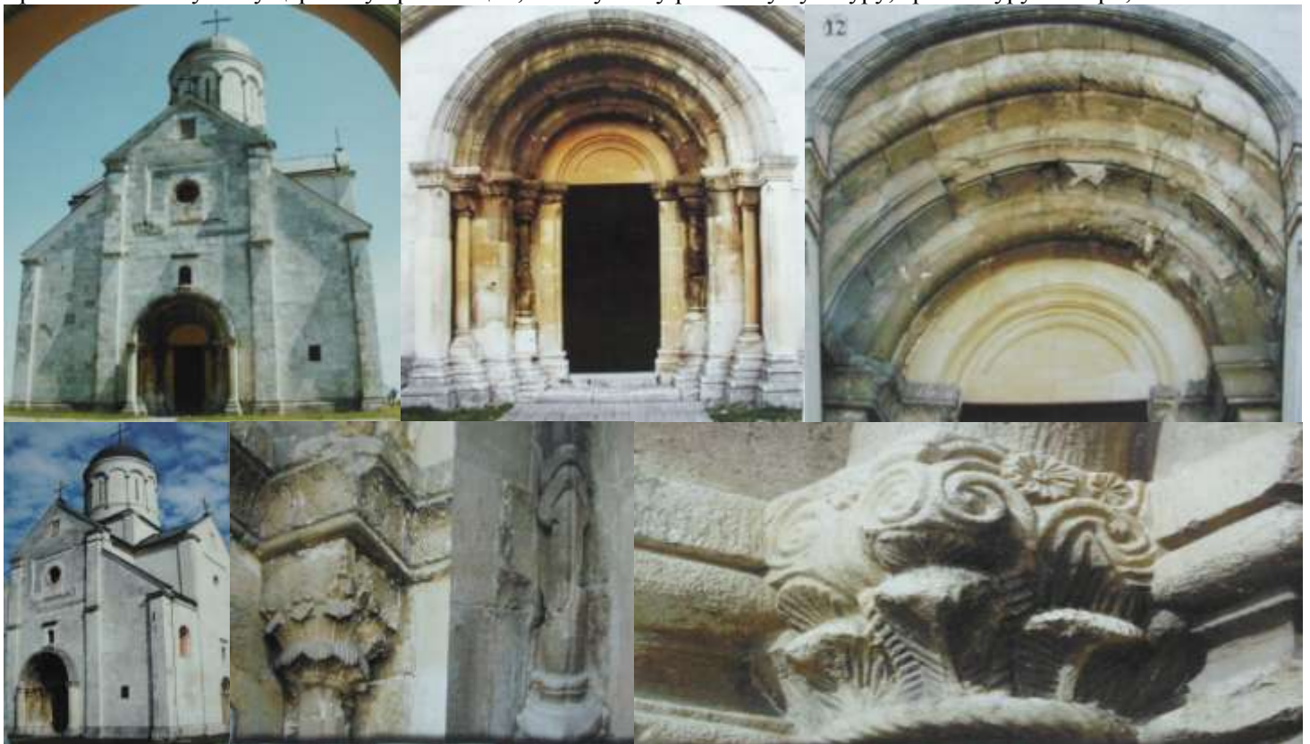
Фото. 10. 11. 12. 13. 14. 15. 16. Романський собор Святого Пантелеймона збудований європейськими майстрами, як символ епохи утвердження Галицького королівства в 1215 році.

В цей же час, в кінці зими на початку весни 1215 року, для утвердження західно-європейських культурних традицій в Галицькому королівстві які активно профункціонували і утвержувалися з 1215 з по 1221 рік, будувалася велика церковна будівля романського стилю, культурно-релігійний романський символ Галицького королівства, який відомий в історичній науці, як собор Св. Пантелеймона, в Галичі. Папа Іннокентій III творив у Галицькому королівстві свою унійну церковну організацію, свою унійну релігійну культуру, архітектуру: собори, замки.