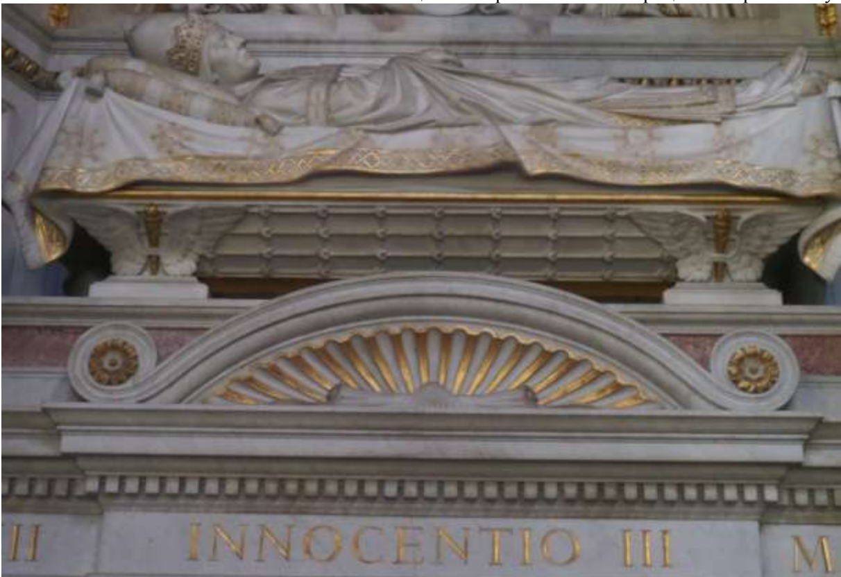
Фото. 19. Пантеон Папи Римського Іннокентія III в Лятиранському соборі в вічному місті Римі.