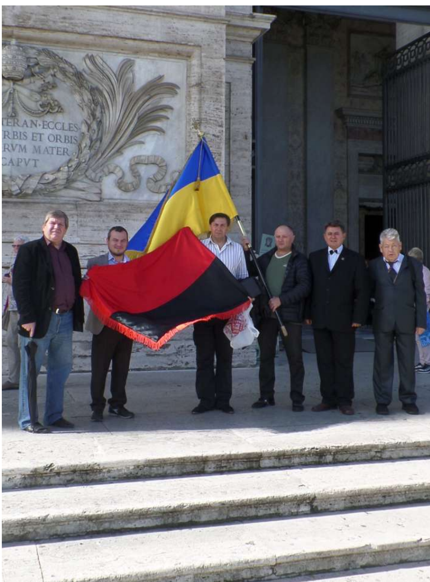
Фото. 20. Керівники делегацій з Інституту Східної Європи, Кафедри Українознавства, Ліги Українського Козацтва, Міжнародному Фонду імені Івана Сірка, які взяли участь у вшануванні 800-ліття відходу у вічність Папи Римського Іннокентія III(1216-2016рр.) - засновника Галицького королівства в 1215 році(1215-2015рр.) перед Лятиранським собором.