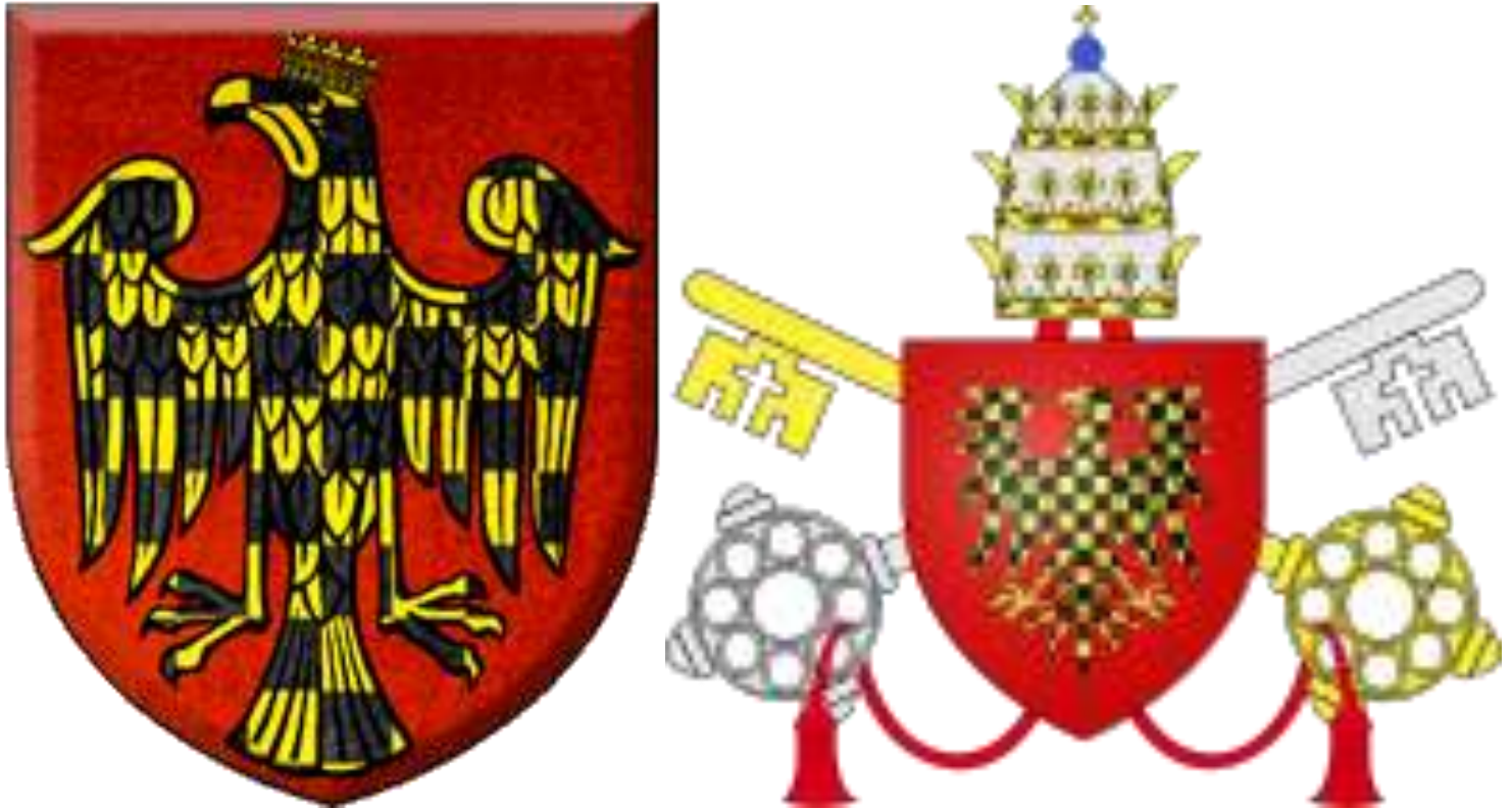
Фото 8. 9. Родовий і Папський герб герб графа Лотаріо де Конті де Сеньї - Папи Римського Іннокентія III.

Як засвідчують джерела, папа римський Іннокентій III (Innocentius III) як світська особа, був сином графа Трасімунда Конті та Клариси Скотті. Слід наголосити, що з родини Конті вийшло 13 римських пап, 3 антипапи, 40 кардиналів, одна королева Антіохії і Тріполі, 7 префектів Риму, 5 сенаторів, 13 полководців, як наприклад славний Торквато і його син Іннокентій відомі з битви у Празі проти шведів. Сам граф Лотаріо де Конті де Сеньї був племінником папи римського Климента III, що вплинуло на його духовну кар'єру. Майбутній папа римський Іннокентій III, граф Лотаріо де Конті де Сеньї народився у 1160 в місті Ананьї в Італії. В подальшому, як граф Лотаріо де Конті де Сеньї, навчався богослов'я в Паризькому університеті і права в Болонському університеті. У вересні 1190 року, його родич папа римський Климент III призначив його кардиналом.