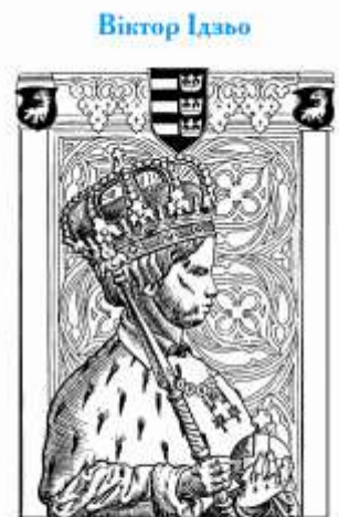
Галицький король Коломан I і процеси першої політико-релігійної унії в Галиччині в першій чверті XIII століття