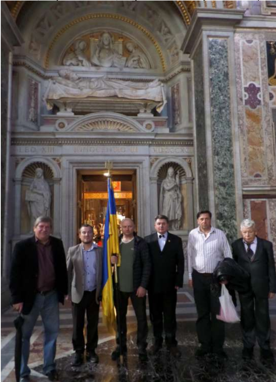
Фото. 17. Керівники делегацій з Інституту Східної Європи, Кафедри Українознавства, Ліги Українського Козацтва, Міжнародному Фонду імені Івана Сірка, які взяли участь у вшануванні 800-ліття відходу у вічність Папи Римського Іннокентія III(1216-2016рр.) - засновника Галицького королівства в 1215 році(1215-2015рр.).

Таким чином у висновок свого виступу наголошу, ініціатором створення Галицького королівства в 1215 році, як і першої Унії Української Церкви з Римської був великий Папа Римський Іннокентій III діяльність якого через призму 800-літньої давності, є актуальною і сьогодні, за яку ми сьогодні вшановуємо його в Лятиранському соборі”.