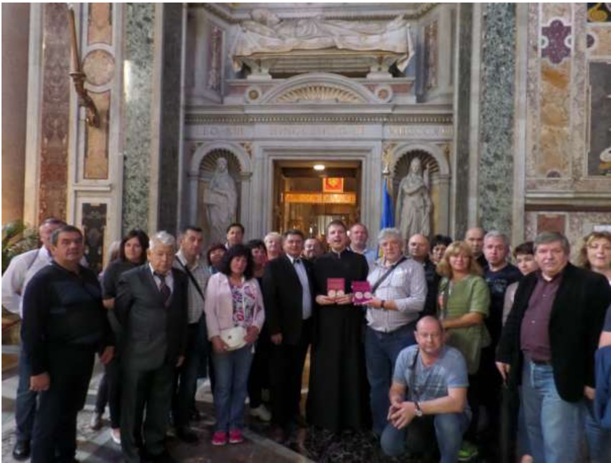
Фото. 18. Українська греко-католицька громада Лятиранського собору, делегація з Інституту Східної Європи, Кафедри Українознавства, Ліги Українського Козацтва, Міжнародному Фонду імені Івана Сірка, які взяли участь у вшануванні 800-ліття відходу у вічність Папи Римського Іннокентія III(1216-2016рр.) - засновника Галицького королівства в 1215 році(1215-2015рр.).