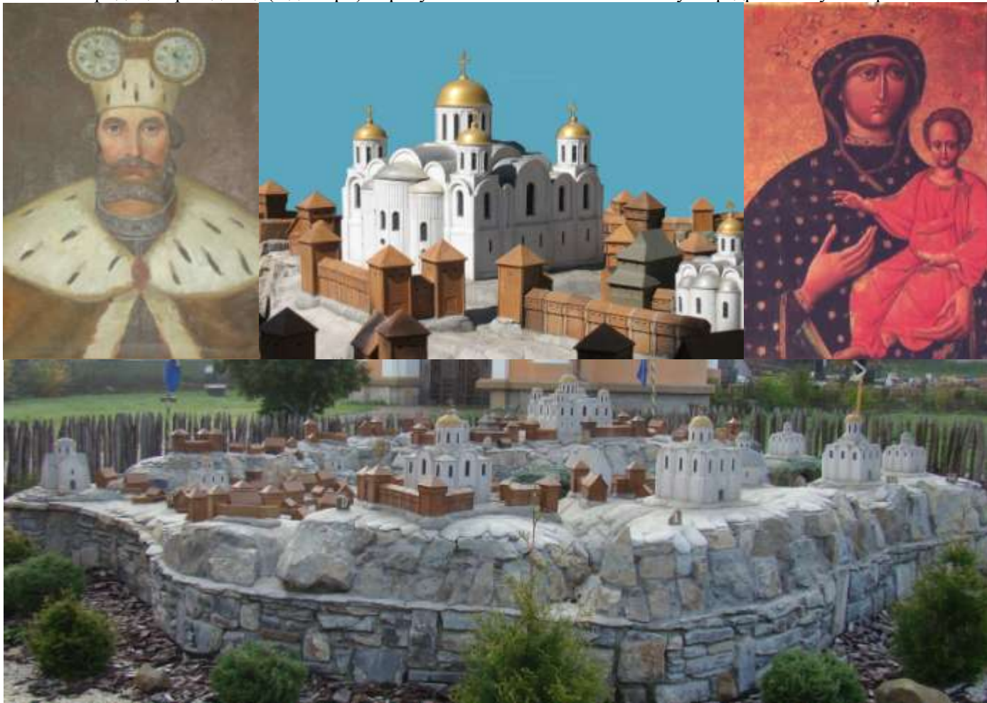
Св.2. Портрет князя Ярослава Галицького. Св.3. Успенський собор у Галичі.

По всій вірогідності ікона Богородиці Провідниці (Одигітрії) знаходилася з X до XII століття у Десятинній церкві. Відомо лише, що великі київські князі у X-XII століттях брали її у воєнні походи, коли захищали Русь-Україну від чисельних ворогів. 22 грудня 1158 року князь Ярослав Володимирович Галицький на чолі своїх могутніх галицьких полків, урочисто вступає в столицю Русі-України, місто Київ. Захопивши Київ він переніс ікону з Києва і поставив її у кафедральному Успенському соборі у місті Галичі. Отже з 1159 року по 1241 рік ікона Богородиці Провідниці (Одигітрії) перебувала в Галичі в Успенському кафедральному соборі.