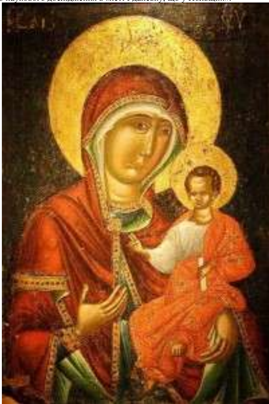
Св.12. Копія ікони Богородиці Провідниці (Одигітрії). Львівський Музей історії релігії.