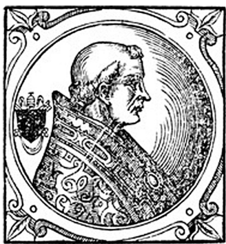
ПАПА РИМСЬКИЙ ГРИГОРІЙ VII. ГРАВЮРА 1600 РОКУ

Убулі за 17 квітня 1075 р., яку Григорій VII направив київському князю Ізяславу, наголошувалося, що він офіційно коронував Ярополка на короля Русі і той отримав Руське королівство із папських рук як дар святого Петра після того, як склав присягу вірності святому Петру, Голові апостолів. У листі від 17 квітня 1075 р. Григорій VII наголошував, що «передав владу над утвореним ним Руським королівством королю Ярополку Ізяславовичу, опираючись на угоду з великим київським князем Ізяславом Ярославовичем від 1073 року». Очевидно, що тоді, коли Ізяслава та його сина Ярополка офіційно приймав глава Церкви в Римі, між ними й було укладено «Угоду про утворення Руського королівства та коронацію Ярополка на короля