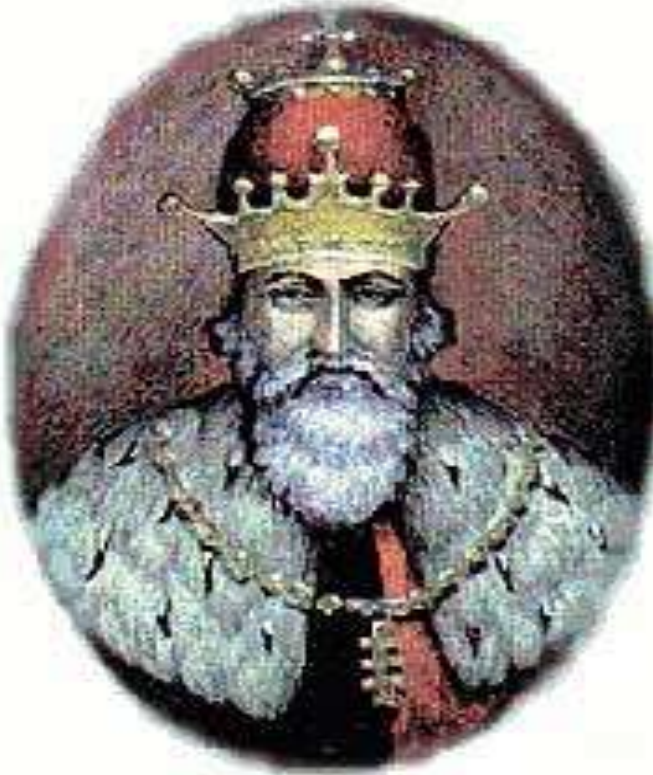
Мал.3. Король Русі-України Данило І.

Викладені нами факти, дозволяють робити припущення, що у середині XIII століття Русь-Україна внаслідок вступу до Союзу католицьких держав повністю забезпечила собі безпеку з боку західних сусідів [14,с.142,с.251,с.261].