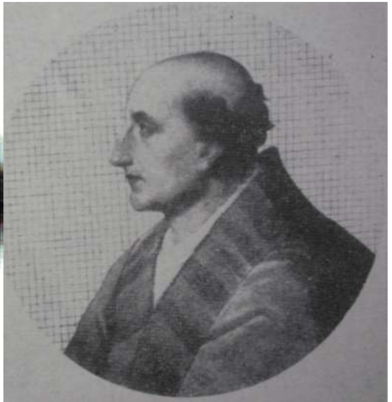
Мал.4. Папа Римський Олександр ІV.

У цей же час в Угорщині перебував український король Данило, який вів переговори з папою Олександром IV про вирішення хрестового походу проти татар, очевидно, такі переговори мали певний результат, оскільки у 1258 році “папа доручив домініканцям і францісканцям об’явити про збір військових сил для хрестового походу проти татарів” [25,р.43, р.75; №186].