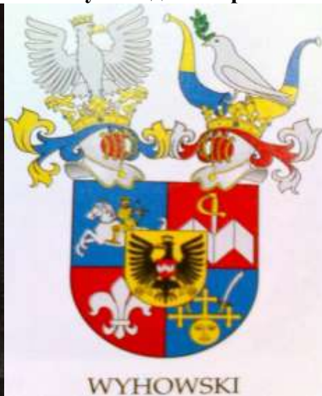
Гетьман України, граф Іван Виговський (Малюнок з літопису Величка).