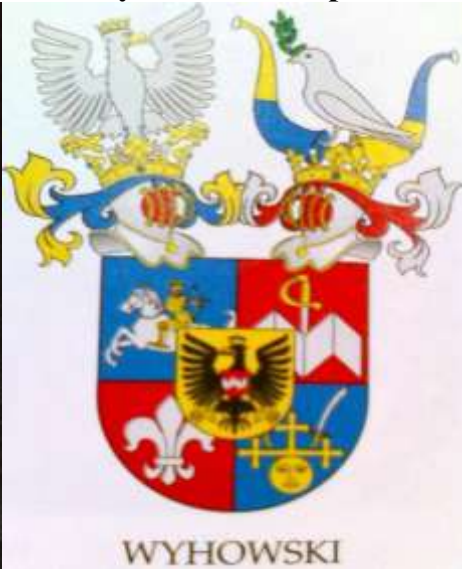
Гетьман України, граф Іван Виговський (Малюнок з літопису Величка).