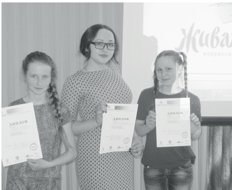
региональном конкурсе «Живая классика», который состоится в апреле 2016 года в г. Горно-Алтайске.

Победители и участники награждены дипломами и грамотами, они представляют МО «Турочакский район» на