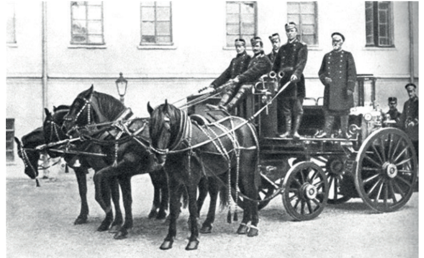
МОСКОВСКИЕ ПОЖАРНЫЕ XIX в.

* В 1971 году при бурении разведочной скважины в Туркменистане геологи наткнулись на подземную полость. Образовался провал, заполненный газом, в который опустилась