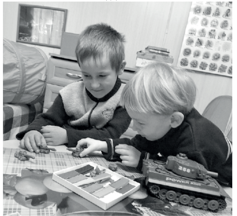
Воспитанники ДЦ «Счастливое детство» на занятии