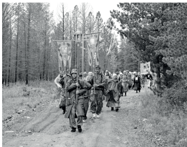
Десятый юбилейный крестный ход «По стопам миссионеров алтайских» стартовал из Горно-Алтайска 5 июля, в нем участвуют около 100 человек, сообща-

ет Горноалтайская епархия. 6 июля после молебна участники крестного хода на автобусах отправились в Акташ, откуда и началась пешая часть запланированного маршрута.