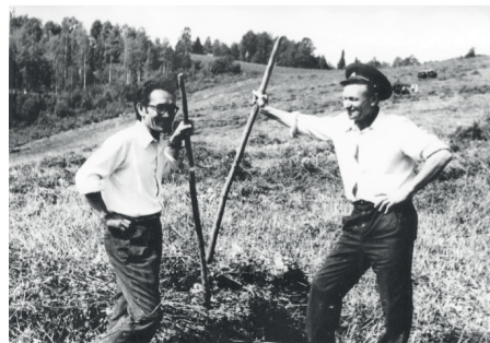
Мнение Редакции может не совпадать с мнением автора

Светлана Скоромная