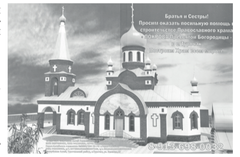
Приход Свято-Никольского храма с. Турочак