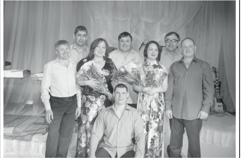
Мы вас ждем, дорогие друзья!