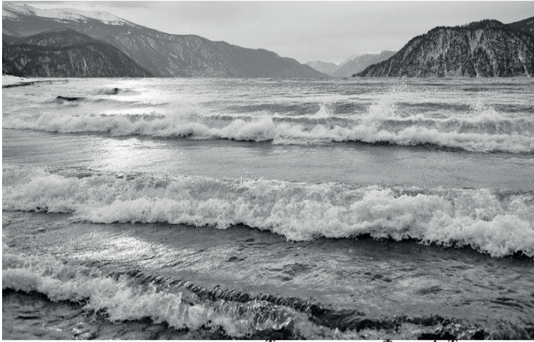
Телецкое озеро.

Вода необходима всему человечеству. На земле 97% - солёной воды, 68% - замершая вода ледяных шапок и ледников, и только один процент доступен для использования человеком. Потребление этого природного ресурса возросло в шесть и более раз. Вода нужна человеку, чтобы утолить жажду, помочь в сохранении жизни и здоровья людей, имеет огромное значение во всех сферах развития