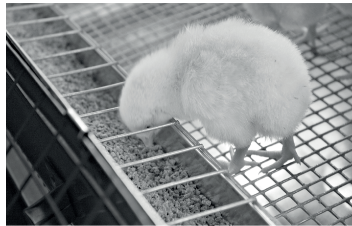
Ещё несколько советов.