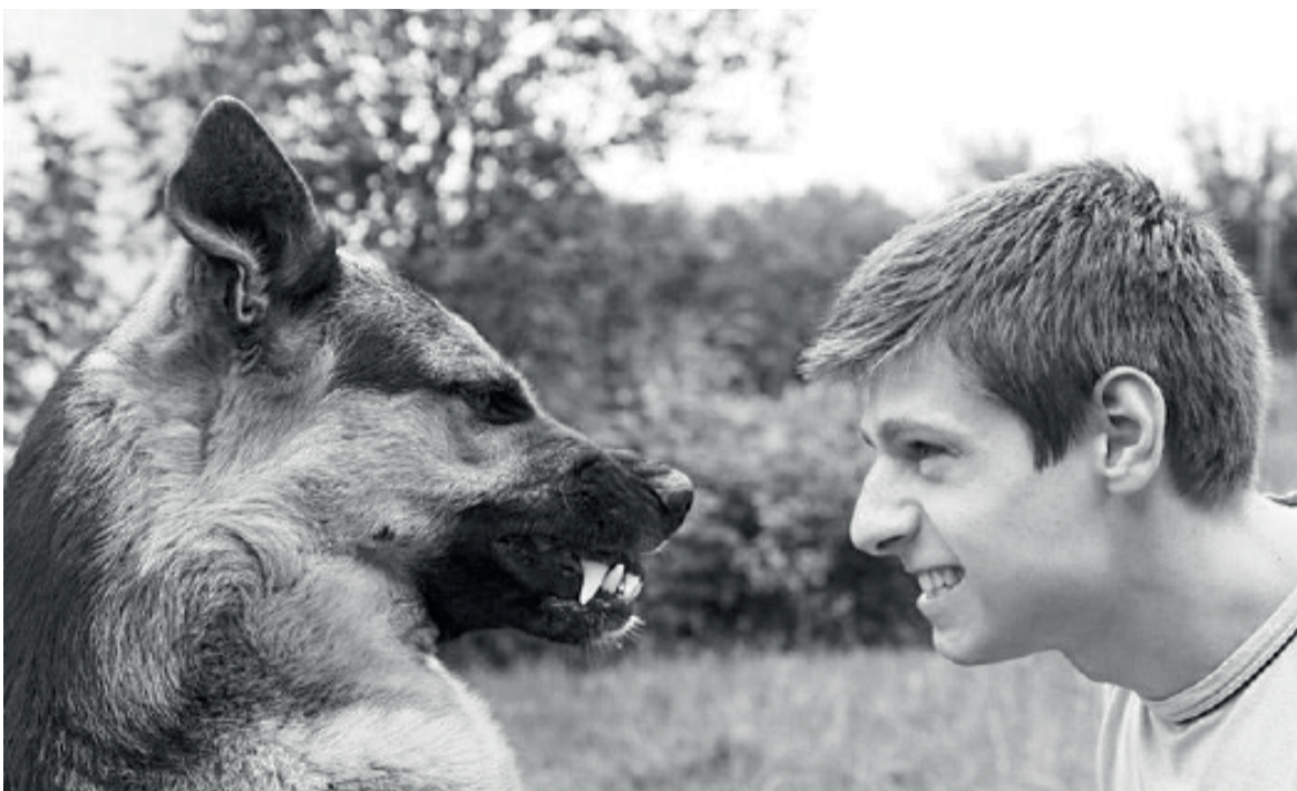
Постарайтесь не провоцировать животное

добных ситуациях очень важно. Основные рекомендации известны каждому из нас. Если собака уже близко, и возможно хочет на вас напасть, спрячьтесь от нее так, где возможно: в подъезде, магазине и т.д., можно даже забежать в озеро или реку – там собака Вас не достанет. Отходить нужно спокойно, повернувшись лицом к псу, так как при попытке бегства собака обязательно вас догонит.