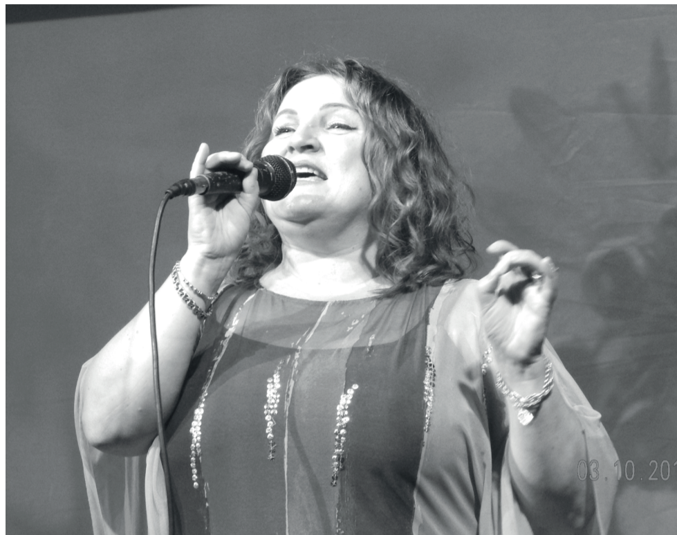
Когда не все равно

- Я точно знаю, что есть среди этих детей две девочки, которых общение со мной чему-то в жизни научило. Вы даже не представляете, сколько «человеческого» можно дать ребенку через уроки вокала!