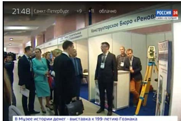
В Музее истории денег - выставка к 199-летию Гознака