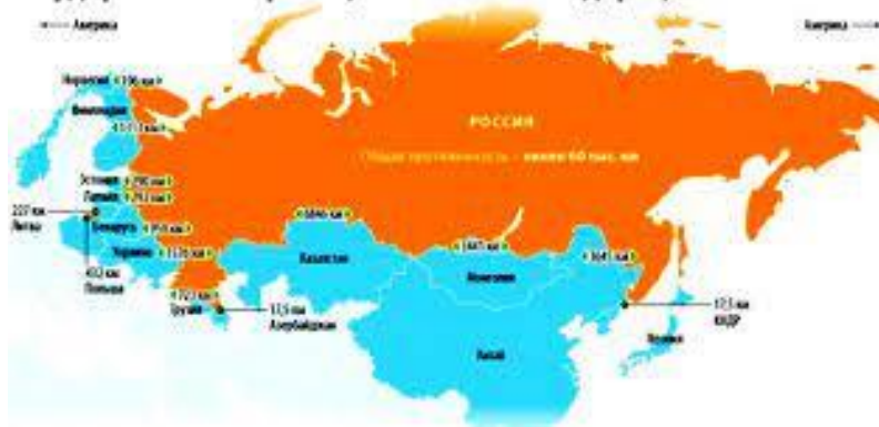
Государственная граница Российской Федерации

Синергетический эффект и вклад в социально-экономическое развитие по обе стороны общей границы: