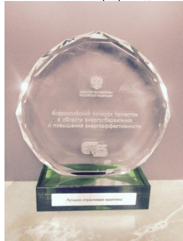
Награда Минэнерго РФ 2014 год ООО «Первая СПб ЭСКО»

Победитель регионального этапа Третьего Всероссийского конкурса реализованных проектов в области энергосбережения и повышения энергоэффективности ENES 2016 ИП «Городское объединение домовладельцев» Санкт-Петербурга Номинация: Эффективная модель привлечения инвестиций, внедрения технологий и инноваций в ЖКХ