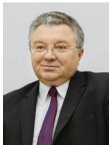
А.И. Рудской, ректор Санкт-Петербургского политехнического университета Петра Великого, академик РАН

В повестке ПМЭФ-2019 значится тема, вынесенная в заголовок. Редакция обратилась к ректору прославленного петербургского вуза Санкт-Петербургского политехнического университета Петра Великого, академику РАН Андрею Ивановичу Рудскому с вопросами по теме.