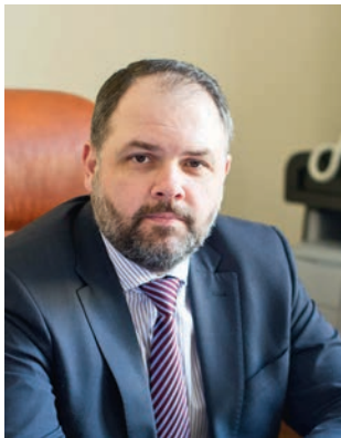
Д.П. Чамара, председатель Комитета по информатизации и связи

Организация процесса предоставления государственных услуг в электронном виде, создание в городе доступной и безопасной информационной среды для комфортного взаимодействия граждан, государства и бизнеса по-прежнему являются нашими важнейшими задачами. И сегодня мы продолжаем постоянную работу в этом направлении.