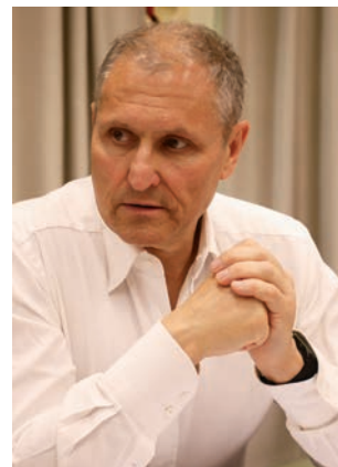
Е. И. Елин, вице-губернатор Санкт-Петербурга

Предполагается также создание единой системы продвижения экспорта. Она позволит обеспечить стандарт качества предоставления услуг российским экспортерам, оперативный доступ региональных компаний на внешние рынки. Планируется, что все 85 регионов получают поддержку, а вместе с ней – доступ на рынки более чем 100 стран. В качестве «пилотных» определены