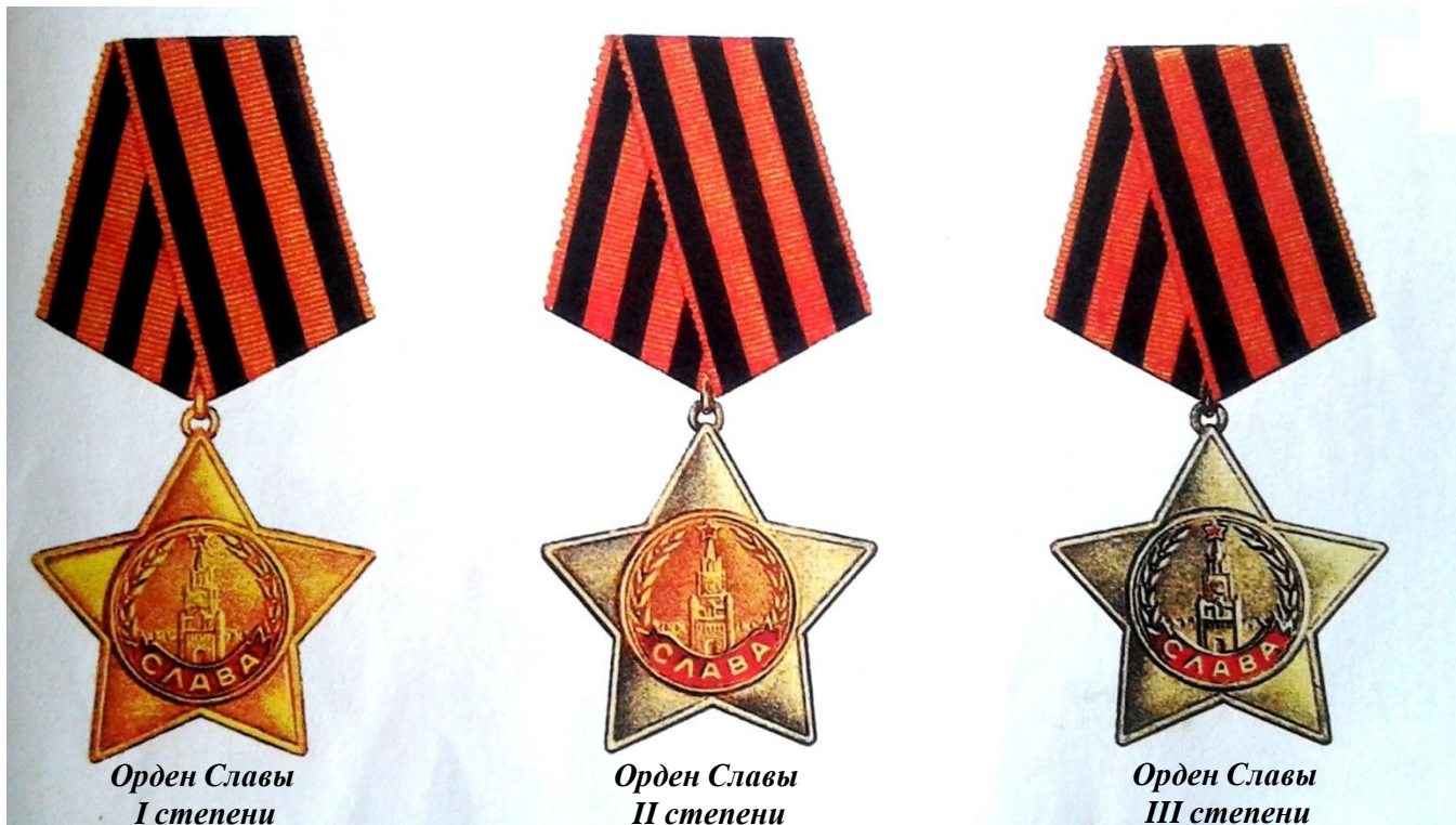
Орден Славы I степени