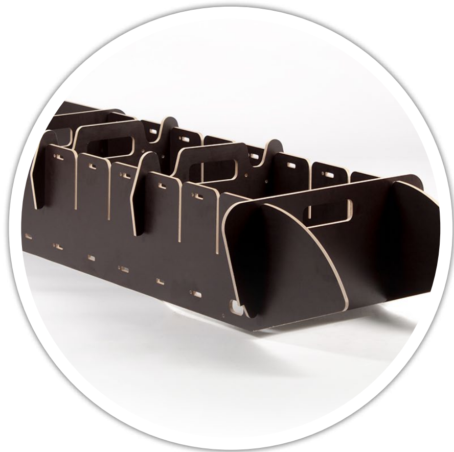
Органайзер для размещения груза

Так же дополнительно можно приобрести органайзер для сортировки груза или новую защиту днища, если на пути встретилось непреодолимое препятствие. И если полозья истерлись – их всегда можно купить отдельно.