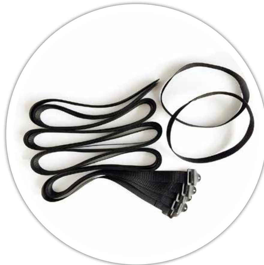
Комплект строп для крепления груза