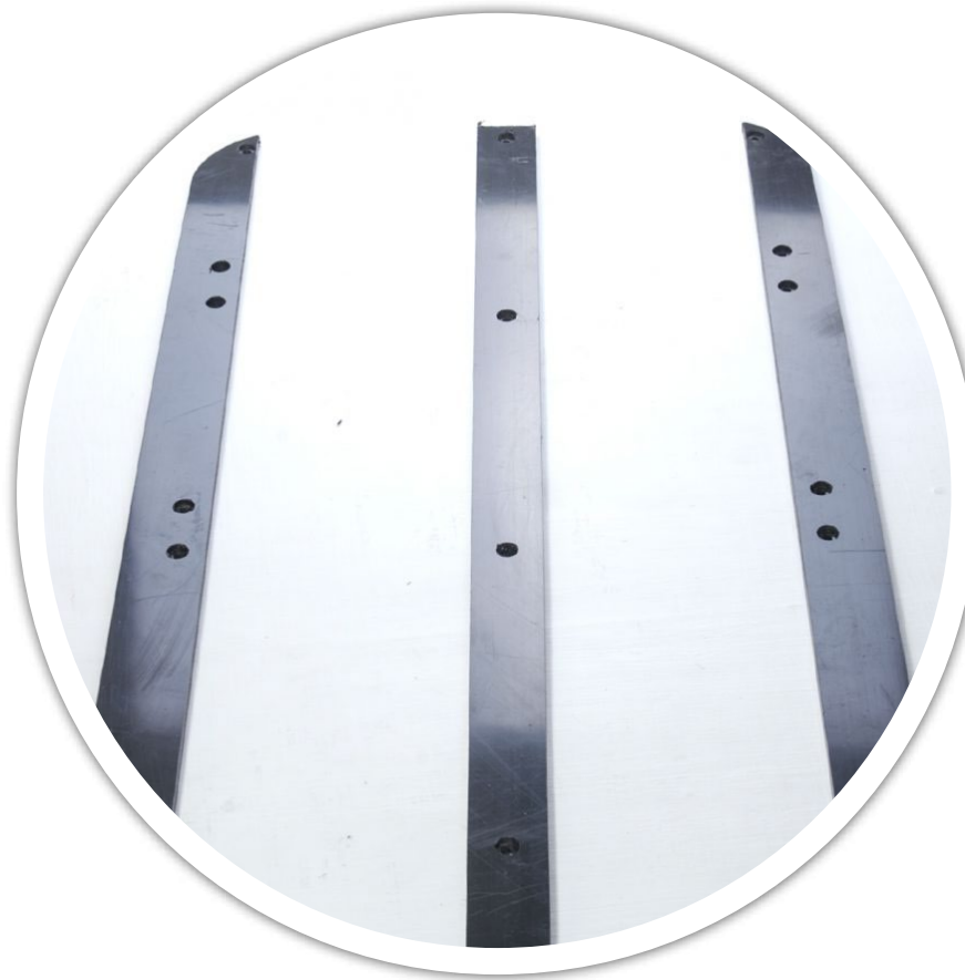
Комплект полозьев для саней-волокуш