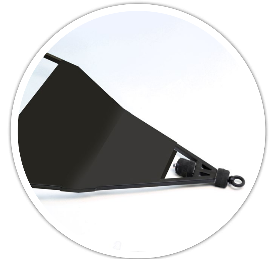
Мягкий чехол на дышло