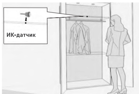
Вариант установки SR2-Door