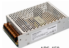
ARS-150 ARS-200 ARS-250