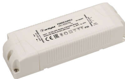
ARJ-KE70700 ARJ-KE86700 ARJ-KE481050 ARJ-KE571050 ARJ-KE301400 ARJ-KE361400 ARJ-KE421400A