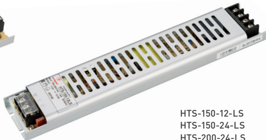
HTS-150-12-LS HTS-150-24-LS HTS-200-24-LS