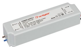
ARPV-LV12060 ARPV-LV12075 ARPV-LV24060 ARPV-LV24075 ARPV-LV24100