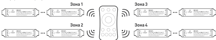
Рисунок 3. Вариант построения системы с 4-зонным пультом дистанционного управления