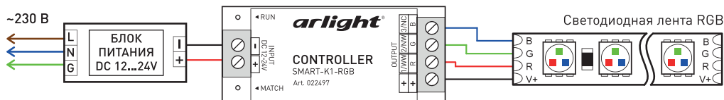
Рис. 1. Подключение светодиодной ленты RGB.

Соблюдайте полярность и порядок подключения проводов к клеммам.