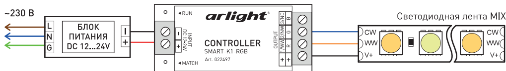
Рис. 2. Подключение светодиодной ленты MIX (CCT).