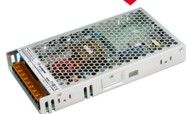
ARS-35-12-FA ARS-35-24-FA ARS-50-12-FA ARS-50-24-FA ARS-75-12-FA ARS-75-24-FA