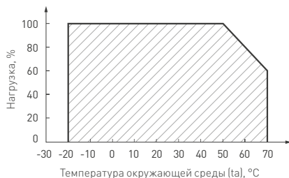
Рисунок 2. Максимальная допустимая нагрузка, % от мощности источника