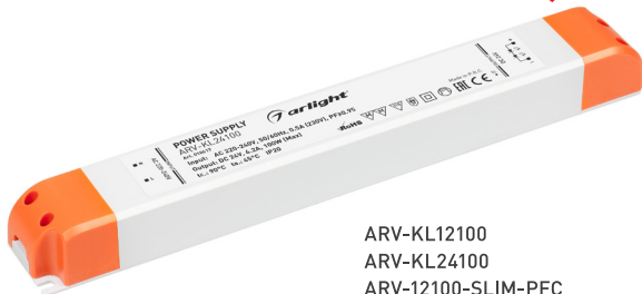
ARV-KL12100 ARV-KL24100 ARV-12100-SLIM-PFC ARV-24100-SLIM-PFC