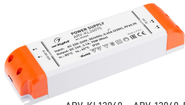
ARV-KL12060 ARV-12060-PFC ARV-KL24060 ARV-24060-PFC ARV-KL12075 ARV-12075-PFC ARV-KL24075 ARV-24075-PFC