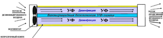
Рис. 1 - Устройство облучателей-рециркуляторов медицинских «Armed» СН111-115 (металлический корпус), СН111-130 (металлический корпус)

5.4. Принцип действия рециркулятора основан на обеззараживании прокачиваемого с помощью вентиляторов воздуха вдоль ультрафиолетовой лампы низкого давления, дающей излучение с длиной волны 253,7 нм.