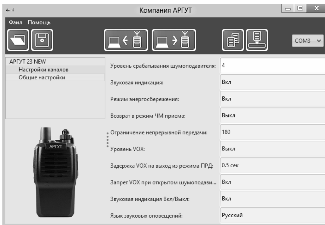
Рис. 9. Окно ПО настройки радиостанции.

Подключите радиостанцию к ПК с помощью кабеля для программирования. Кабель для программирования подключается к аксессуарному соединителю радиостанции (см. рисунок 8), а другим концом — к USB-порту ПК. Запустите ПО и выберите модель радиостанции «Аргут 23NEW». Включите радиостанцию. Светодиодный индикатор будет мигать зелёным раз в пять секунд. Нажмите программную кнопку «Прочитать из станции» в верхней части окна ПО. Светодиодный индикатор радиостанции будет часто мигать зелёным, в окне настроек появятся текущие установки параметров радиостанции.