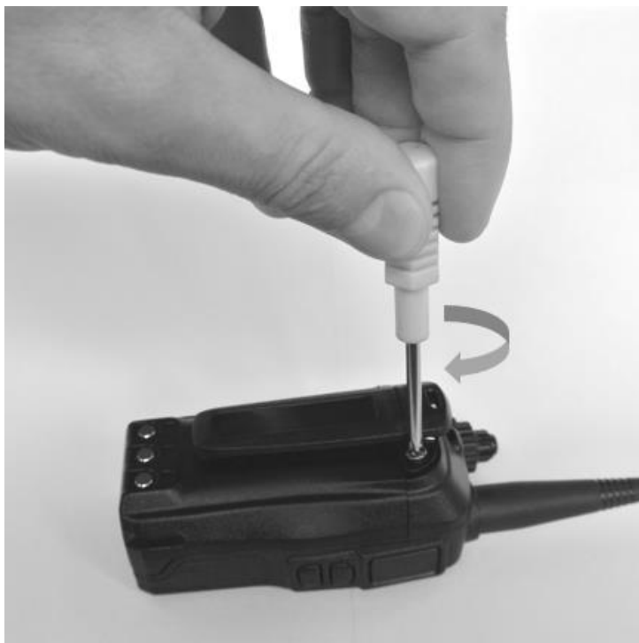
Рис. 5. Присоединение клипсы для крепления.

Если вы планируете носить радиостанцию на поясном ремне или крепить к одежде, присоедините к задней панели клипсу. Совместите крепёжные отверстия клипсы с отверстиями на задней панели и закрепите клипсу с помощью двух винтов из комплекта. Используйте крестовую отвёртку №3.