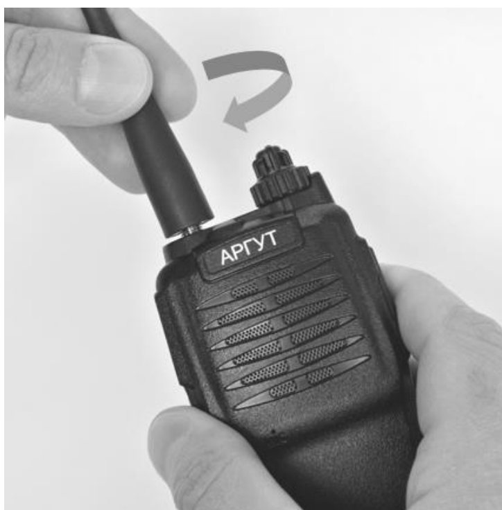
Рис. 4. Присоединение антенны.

Совместите резьбовой соединитель антенны с ВЧ-соединителем на верхней панели радиостанции. Вращая антенну по часовой стрелке закрутите соединитель до упора. Не прилагайте чрезмерных усилий при затяжке.