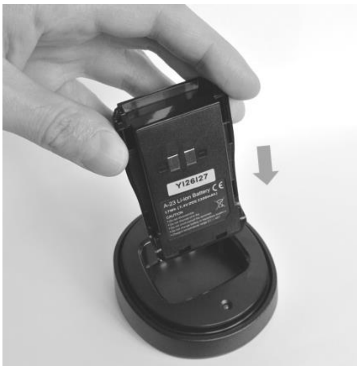
Рис. 7. Установка аккумуляторной батареи на зарядную базу.