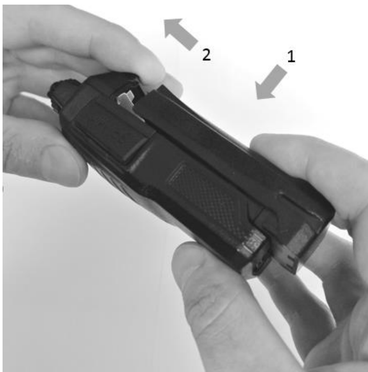
Рис. 2. Установка аккумуляторной батареи.

Совместите направляющие на аккумуляторной батарее с направляющими на шасси приёмопередатчика. Прижмите батарею к шасси и сдвиньте влево до щелчка.