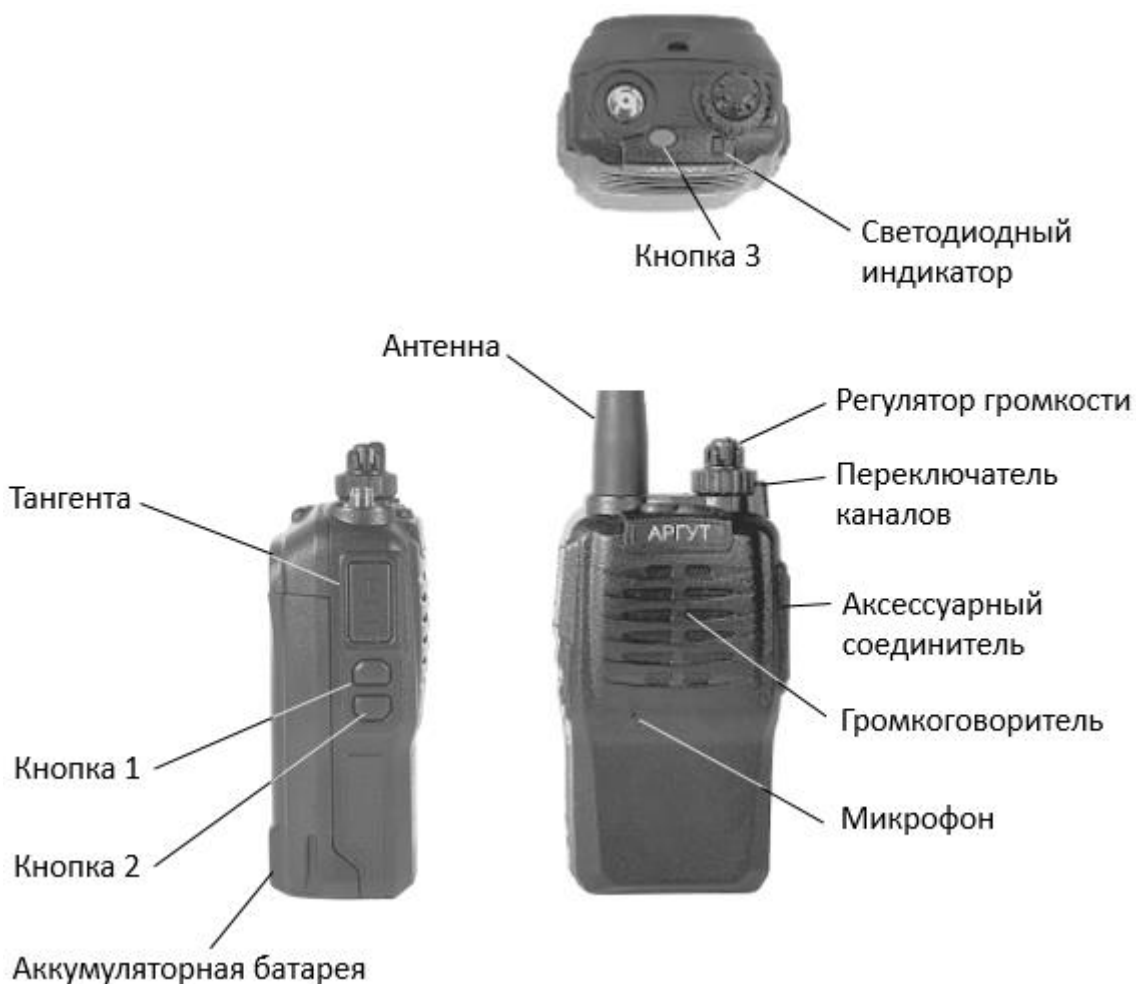
Рис. 1. Расположение органов управления, индикации и соединителей.

Радиостанция выполнена на металлическом шасси, в корпусе из ударопрочного пластика. Органы управления и индикации расположены на верхней и левой панелях корпуса. Соединитель антенны — на верхней панели. Соединитель подключения гарнитуры и кабеля программирования (аксессуарный соединитель) — на правой панели. Клеммы для присоединения к зарядной базе — на задней стенке аккумуляторной батареи.