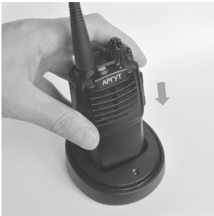
Рис. 6. Установка радиостанции на зарядную базу.

Установите радиостанцию с присоединённым аккумулятором на зарядную базу. Светодиодный индикатор на зарядной базе загорится красным. По окончании зарядки индикатор сменит цвет на зелёный — снимите радиостанцию с зарядной базы.