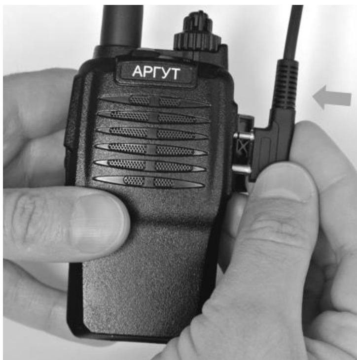
Рис. 8. Подключение гарнитуры.

Если вы приобрели гарнитуру и планируете её использовать, подключите её к радиостанции. Для этого отведите в сторону защитную крышку и подключите гарнитуру к аксессуарному соединителю.