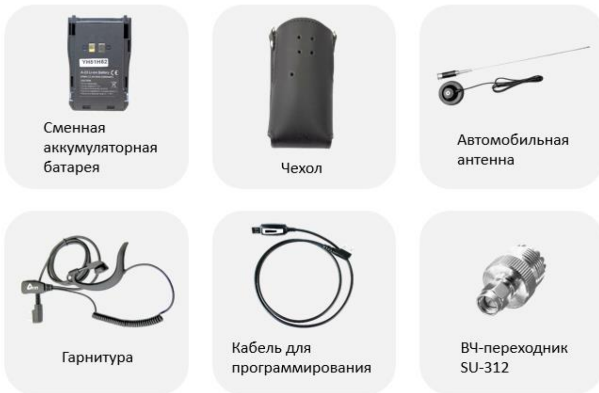
Рис. 10. Рекомендуемые аксессуары.

Рекомендуемые аксессуары Аргут к радиостанции представлены на рисунке 10.