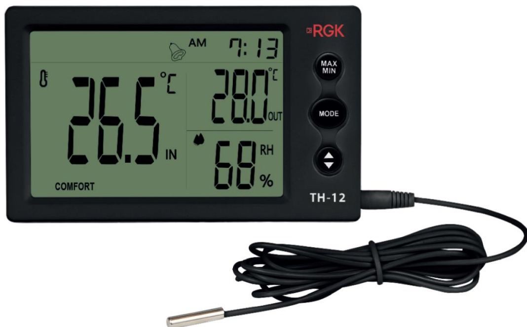
Рисунок 2 – Общий вид термогигрометров RGK модели TH-12 (с внешним датчиком)