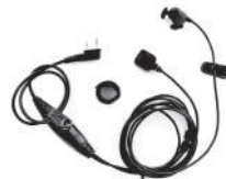
TurboSky TK-6 Ушной ларингофон с выносной кнопкой PTT на палец