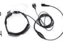
TurboSky TK-5 Ларингофон скрытого ношения с выносной кнопкой PTT на палец и регулировкой ширины