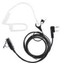
TurboSky TK-2 Гарнитура скрытого ношения с прозрачным звукосводом