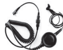
TurboSky TK-7 Ушной ларингофон с большой кнопкой PTT