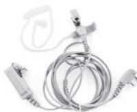
TurboSky TK-3 White Гарнитура скрытого ношения с прозрачным звукосводом