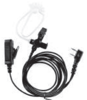
TurboSky TK-3 Black Гарнитура скрытого ношения с прозрачным звукосводом