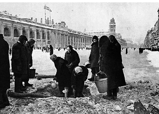
Источник жизни у входа в «Пассаж»

Возвращаясь, я наблюдал такую сцену: у решетки, когда-то снятой с Зимнего дворца, за Кировским райсоветом, упал человек. Его котомка свалилась на землю. Поднимался он медленно, я решил, что это глубокий старик. Когда подошел к нему с другой стороны улицы, он все еще стоял на одном колене, беспомощно пытается встать. Я помог ему и с горечью убедился, что человек этот моложе меня лет на десять – двенадцать. Оказалось – рабочий