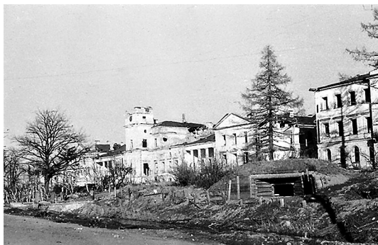
Бывшая больница имени Фореля. 1942 год.

В 1847–1850 гг. были возведены корпус для служащих больницы (пр. Стачек, 160) и корпус для неизлечимых больных (д. 148), а в 1853 г. выстроена каменная часовня для отпевания.