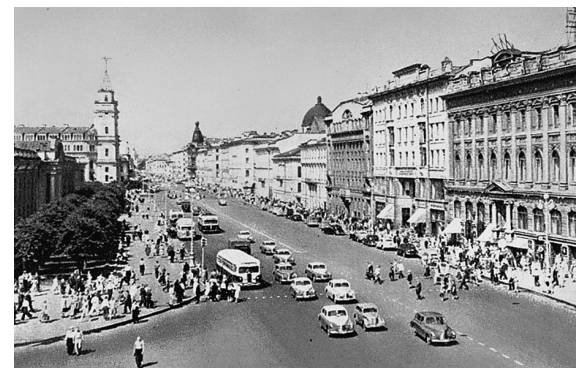
50-е годы. Восставший из руин Ленинград. Пешеходный переход напротив «Пассажа». Справа, рядом с переходом, черное пятно. Возможно, это люк на том самом месте, где брали воду в блокаду

Кировского завода, идет с одеялом, чтобы работать, не уходя из цеха, так как ходить домой сил нет. Кроме хлеба один раз в день он получает жидкую пшеничную баланду. С завода каждый день выходят отремонтированные танки. Это совершают люди, умирающие от истощения у своих станков.