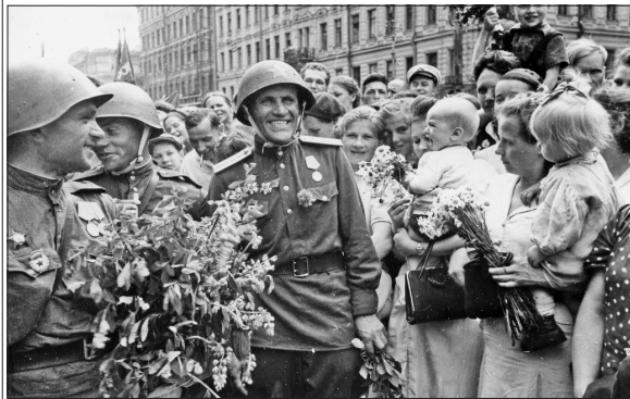
Визитница победителей. Ленинград, 1945 г.