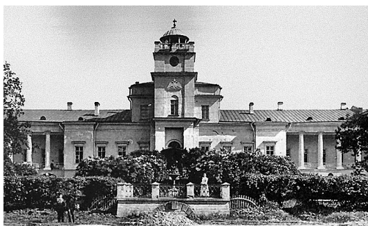
Больница на дореволюционном снимке

В 1922 г. больницу назвали именем швейцарского невропатолога и общественного деятеля Огюста Анри Фореля, который дружил с А.В. Луначарским и высказывал свои симпатии к СССР. Церковь ликвидировали, ее помещение передали под клуб.