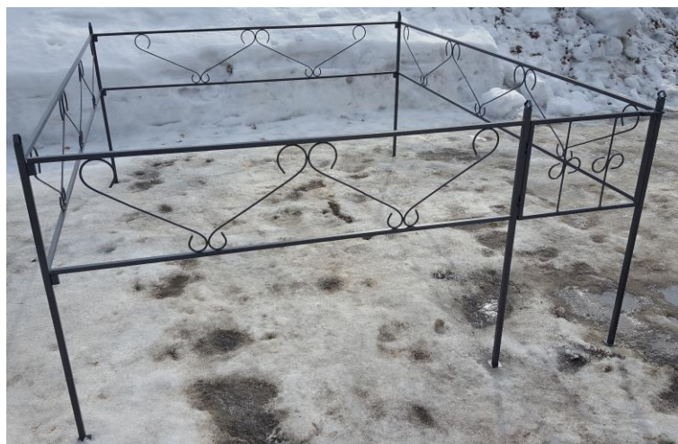
Оградка № Б8