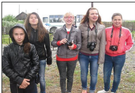
Рисунок 4. Юнкоры пресс-клуба «Хрустальное перо»

Весь парадокс в том, что Германия, где в 40-е годы XX века господствовал и откуда начал свое шествие по Европе фашизм, до сих пор кается перед всем миром за геноцид, преступления против человечества. А страны, в которых население знает о бесчеловечности нацистских идей, допустили его распространение в сегодняшние дни. Именно страны, поскольку профашистские организации существуют не только в Украине, но и во многих государствах, включая Россию! Это лимоновцы, скинхеды, «фашики». Их далеко не безобидные выходки и, можно сказать, преступления, покрыты налетом расизма, аризма, нацизма. Вот такие «змы». А военные сводки из Украины о чем, как не о геноциде?