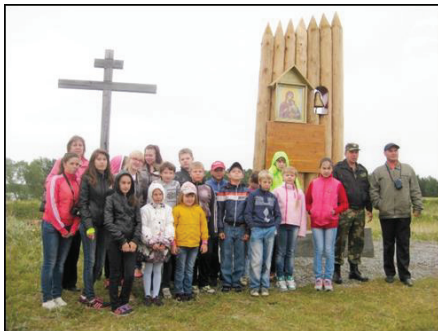
Рисунок 1. На месте казачьего Саянского острога

тям о войне» и др. Проводят фотовыставки: «В надежном имени Мужчина», «Живи, казачество».