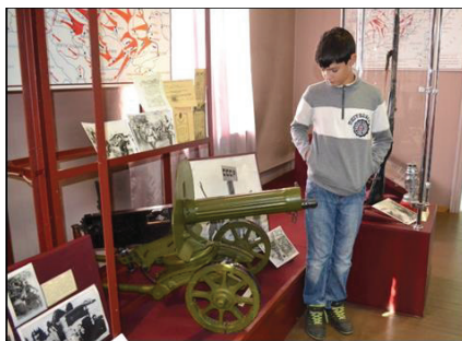
Рисунок 2. В Минусинском краеведческом музее

«Огромную роль в приближении окончания войны сыграли сибиряки. В тылу женщины, старики, дети, подростки вносили свой, можно сказать непосильный, вклад в приближение долгожданного Дня Победы. На фронтах сибирские дивизии наводили ужас на фашистов. Газета «Берлинер берзегцейтунг» в 1942 году цитировала письмо немецкого офицера с фронта: «Мы не можем податься ни вперед, ни назад. В снежных блиндажах находится цвет Советской Армии – сибирские стрелки». В последующем номере эта же газета написала: «Мы недооценили русскую армию и ее оружие». Немецкие войска не вынесли урок из прошлого. Недаром Александр Македонский, загоняя шведов в озеро, говорил: «Кто с мечом к нам пришел, от меча и погибнет».