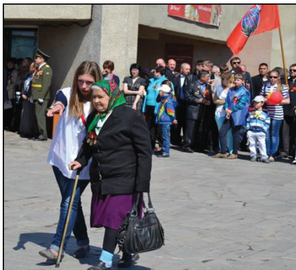
Рисунок 3. Пресс-клубовцы 9 Мая

Их души маются над Грозным, Грустя, глядят на Гудермес, Взывать к кому-то слишком поздно: Никто из мертвых не воскрес. Пусть города возводят снова, Но тех, кто умер, не вернуть. Война для нас не просто слово Беда, хоть и к бессмертью путь.